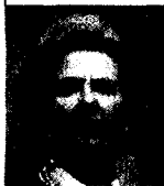
铁 娘 子 撒切尔夫人

在从政之初，他本是一个带有自由主义倾向的议员，但一次大战后他成了保守主义分子。不过，在那些日子里自治议会中没有保守党员，自治议会由独立党团或纳税人议员操纵着，那时它们面临的是社会主义者的新挑战。只是在以后，现行的三党制才进入了