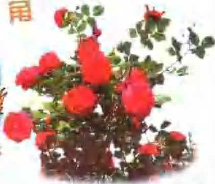
蔷薇属花卉是世界著名的庭院观赏植物。