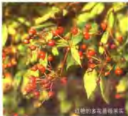
红艳的多花蔷薇果实