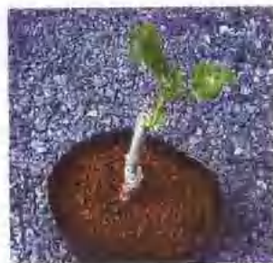
用嫁接法繁殖的月季幼苗。

花期： 现代月季是经多次杂交，长期选育而成的杂种月季品种群，连续开花，而以5~6月及9~10月为最盛。