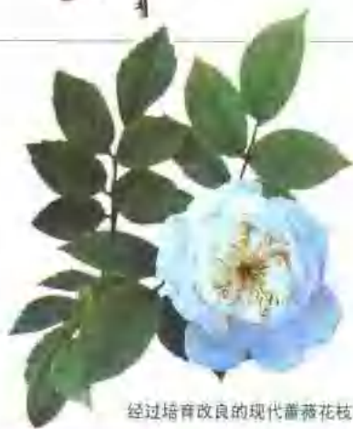
经过培育改良的现代蔷薇花枝。