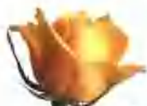
蔷薇亚科植物的花叶。

蔷薇科植物有很多是重要的果树品种，例如苹果、沙果、海棠、梨、桃、李、杏、梅、樱桃、枇杷、山楂、草莓和树莓等。常见的观赏植物有各种蔷薇、月季、玫瑰、绣线菊、绣线梅、珍珠梅、海棠、梅花、樱花、碧桃、花楸、榆、珍珠梅、榆叶梅、白鹃梅等。地榆、龙芽草、翻白草、郁李仁、金琥珀和木瓜等均可供药用。乔木种类的蔷薇科木材多坚硬细致，有多种用途，如梨木、桃木、樱桃木、枇杷木和石楠木等。玫瑰、蔷薇、月季等的花瓣可以提取芳香油，用来配制高级香水及饮料等等。