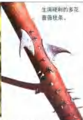
生满硬刺的多花蔷薇枝条。

地栽多花蔷薇时，栽前应开沟施底肥，春季要经常浇水。每年从根部长出新的长枝条，当年在其侧枝上开花。花后，应剪除开过花的枝条。多花蔷薇十分耐寒，生长过程中，雨季要注意排水防涝，应施肥2~3次，促使未开花的花枝在第二年开花。