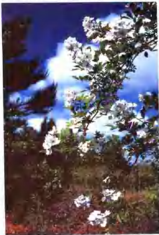
攀缘而生的野生蔷薇。

野生蔷薇多自然分布于溪畔、路旁及园边、地角等处，往往密集丛生，满枝灿烂，微雨或朝露后，花瓣红晕湿透，景色颇佳。