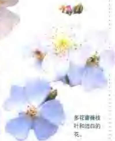
多花蔷薇枝叶和洁白的花。