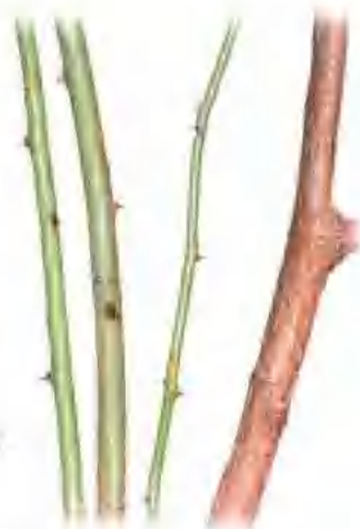
蔷薇枝条上生有尖锐的皮刺。

生长习性: 喜欢阳光, 也能半阴, 比较耐寒, 不耐涝, 疏松、肥沃、排水良好的土壤最适宜生长。