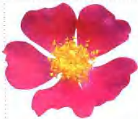
典型的五瓣蔷薇花。