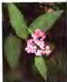
绣线菊亚科植物的花叶。