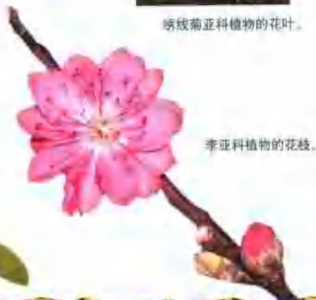
李亚科植物的花枝。