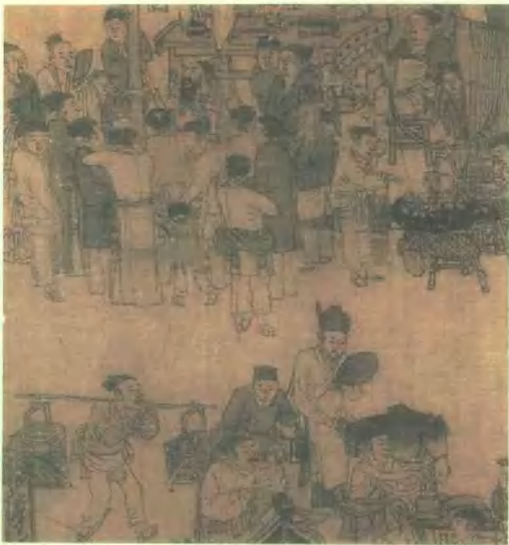
街头相术大师在相面