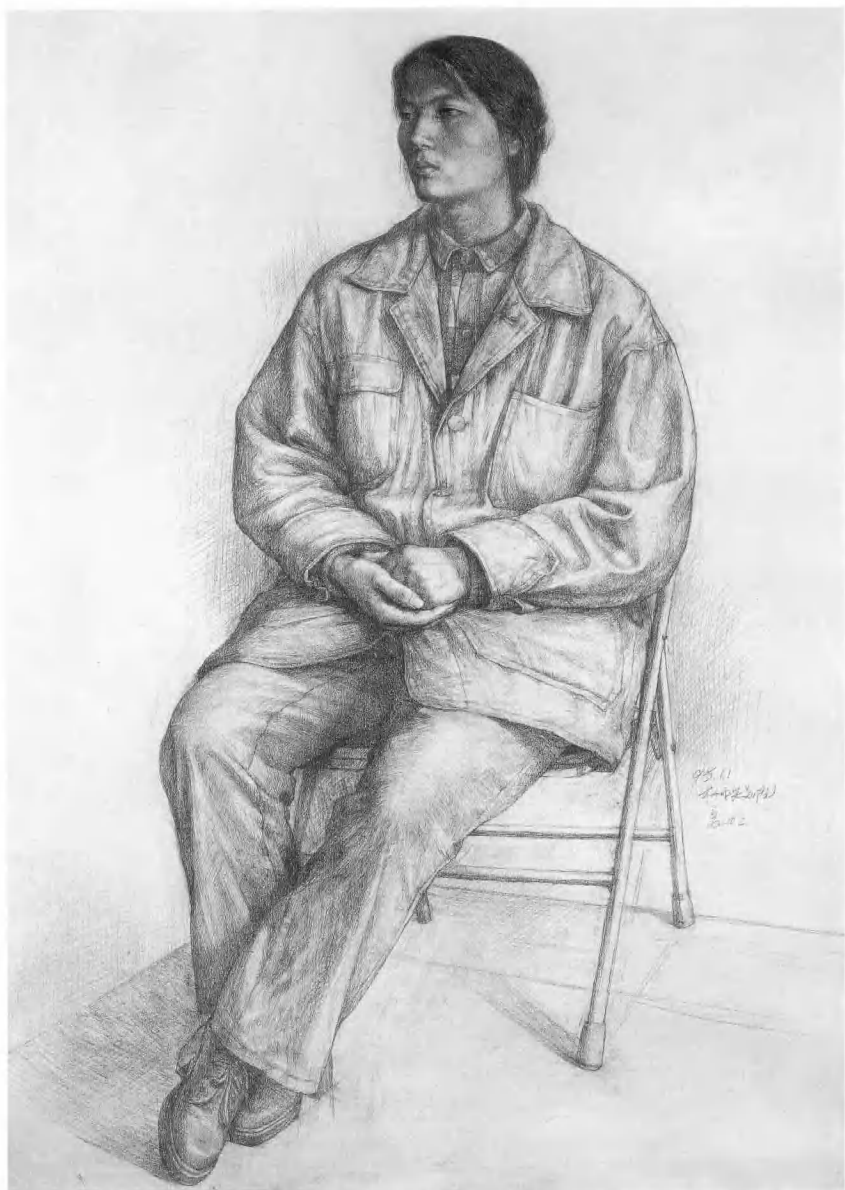
五、完善画面效果，强调概括和整理。在作画中要始终树立造型意识，形体概念，坚持四个基本原则：一是整体的原则；二是理解的原则；三是立体的原则；四是表现的原则，使正面效果更加强烈生动。