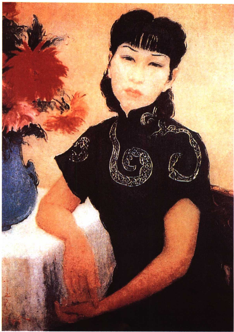
油画《自画像》 着乡衣，溢乡愁。