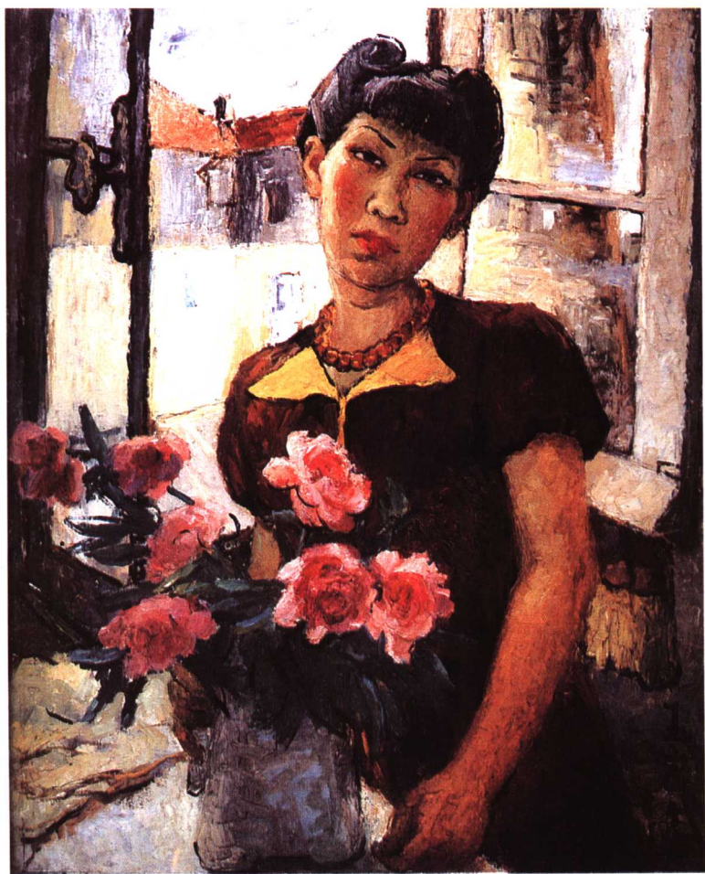
油画《自画像》 拥一束玫瑰，你忆起了什么？