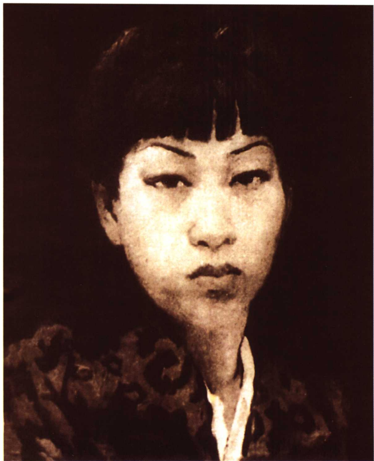
油画《自画像》 乡愁何时了？