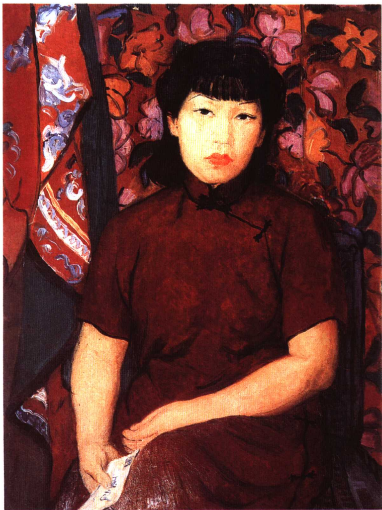
油画《自画像》 家信，勾起了无尽的乡思和爱恋：贇化，我也想你了。