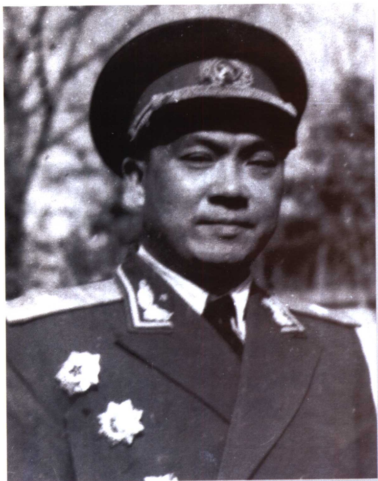
一九五五年中央军委授衔时摄。