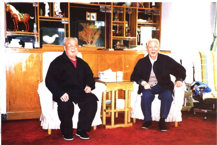
一九九九年四月，戴润生（左）在刘华清（右）家中做客。