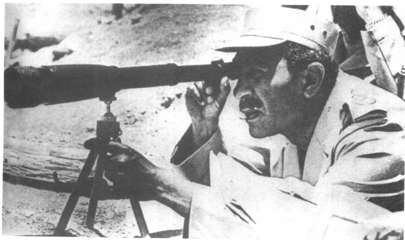
●第四次中东战争中，埃及萨达特总统在观察敌情。