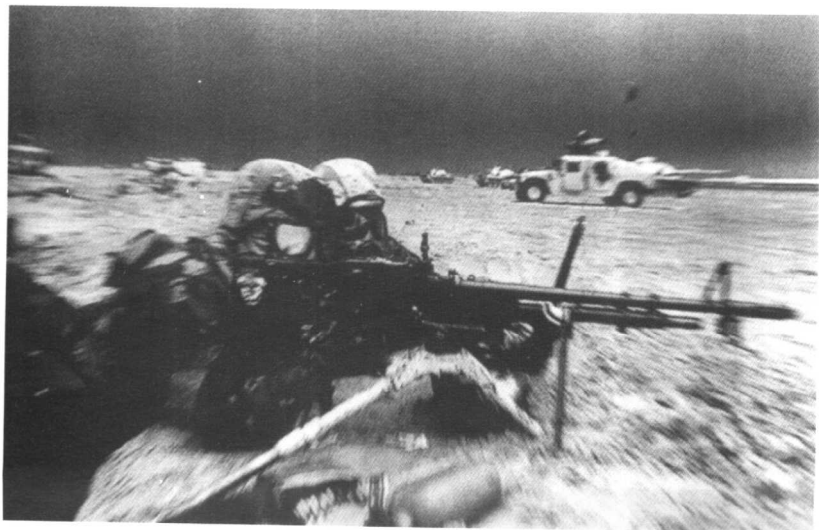
●1991年在“沙漠风暴”行动中与伊拉克地面部队作战的美国士兵。