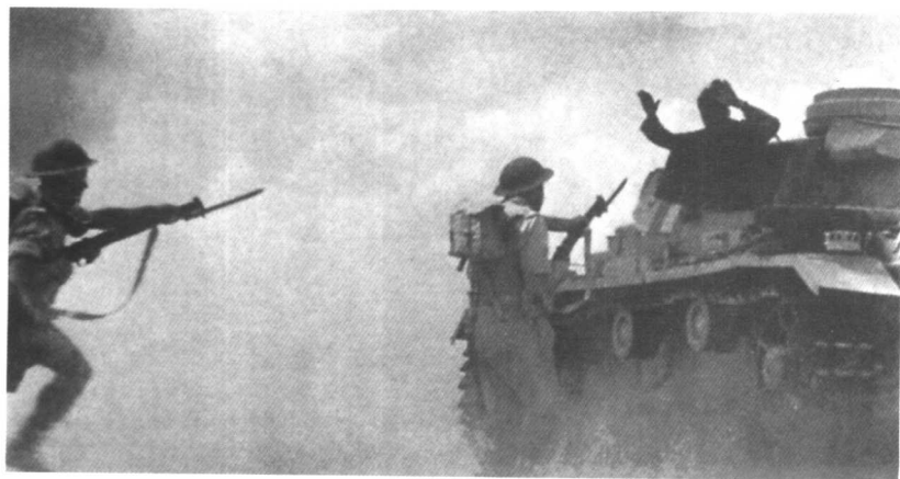
● 1941年，英军在阿拉曼战役中击败隆美尔率领的德军部队，这是盟军在非洲获得的首次大的胜利。