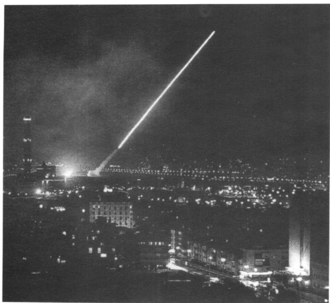
●在海湾战争中，美制“爱国者”导弹在特拉维夫上空迎击伊拉克“飞毛腿”导弹。