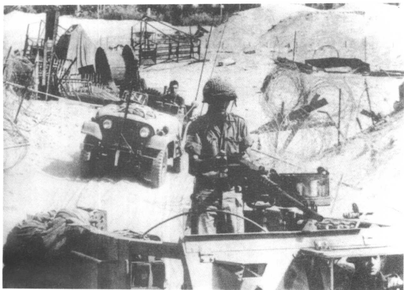
●第三次中东战争中，约旦河西岸大部分地区被以军占领。