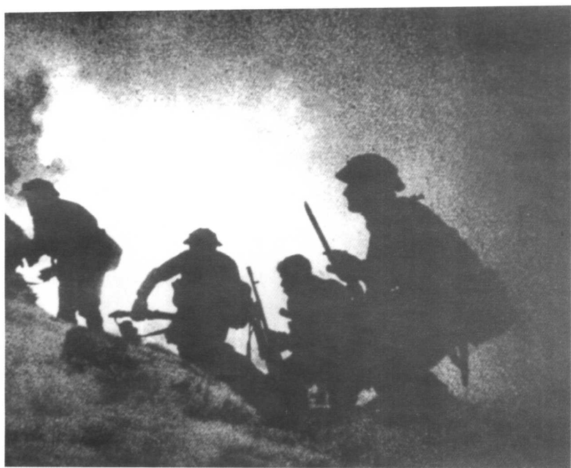
● 1941年12月，一支英军地面部队冒着飞沙走石向北非的德军发动了代号为“十字军”行动的攻势。