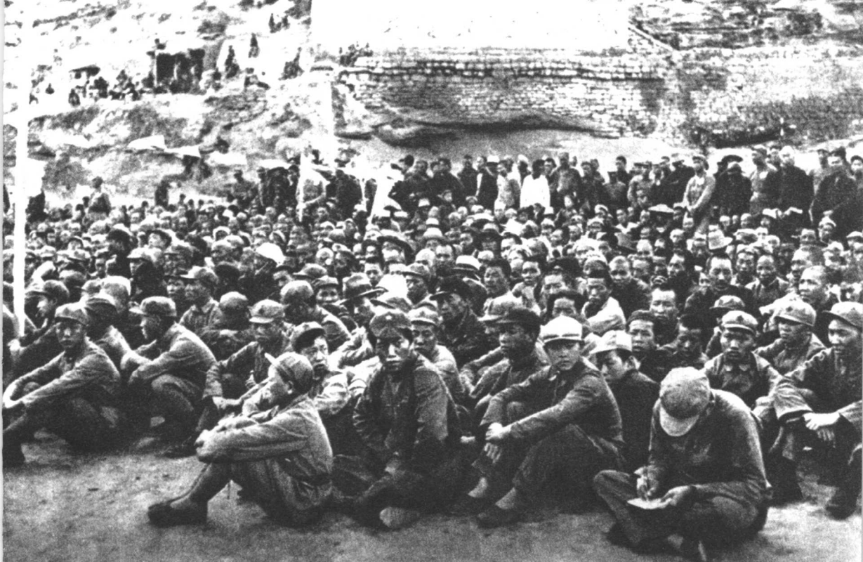
中央红军到达陕北