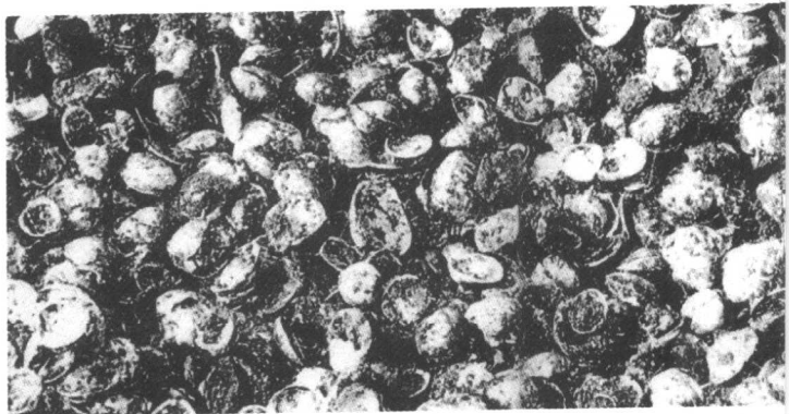
图 1-1 贝壳砂带

国际旅游人士到中国来,认为到西安欣赏两千年的古都,到北京参观五百年的京城,到上海游览百年的近代都市。其实并不尽然。上海有历史文明记载已有1600余年,远在史前文化可以追溯到6000年左右。