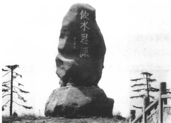
黄浦江水文化博物园的饮水思源碑