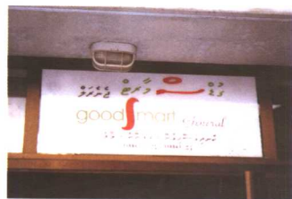
迪维希语和英语书写的标牌