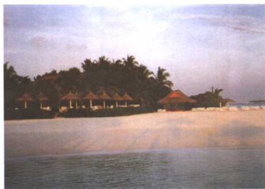
别具风格的度假村设施