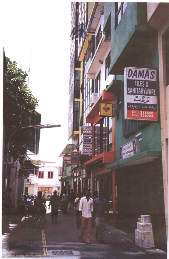
马尔代夫的首都—马累—瞥