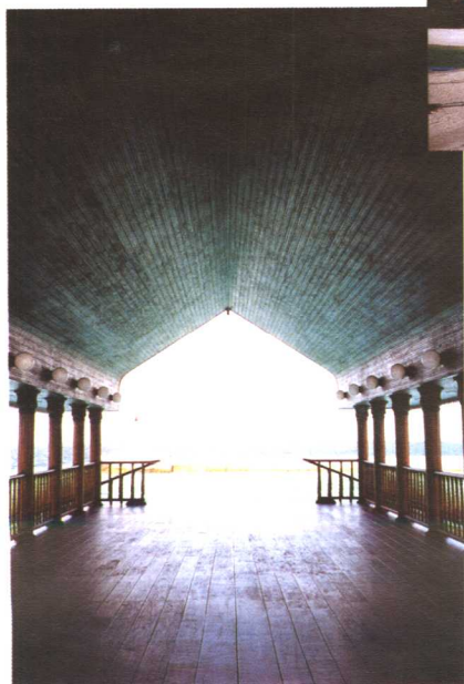
马累军港