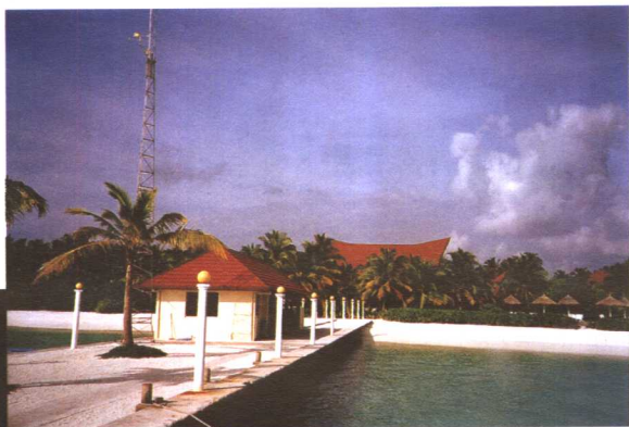
度假村与绿树、碧水、蓝天融为一体