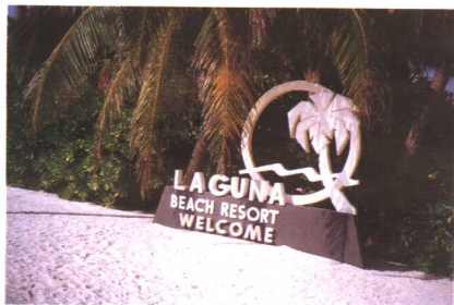
拉古纳海滩的旅游宾馆标牌