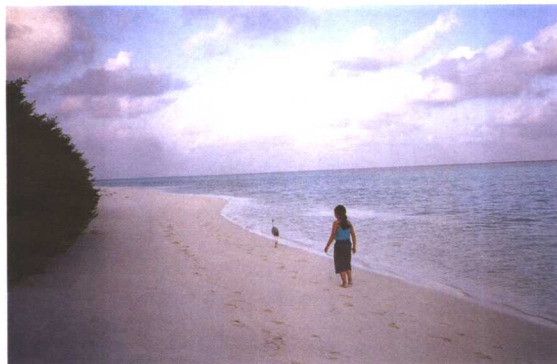
人与沙鸥一起漫步