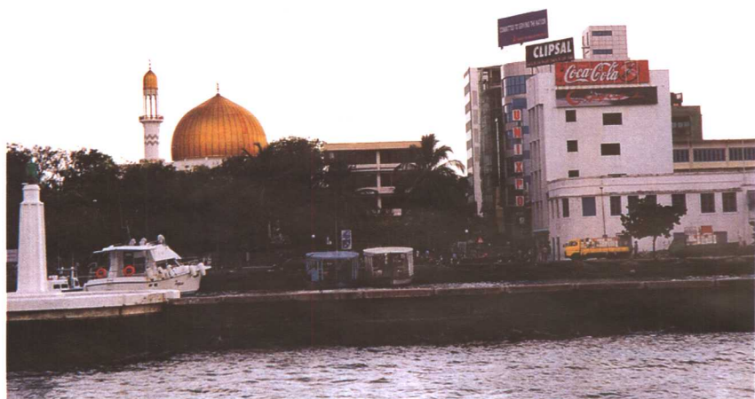
星期五大清真寺远眺