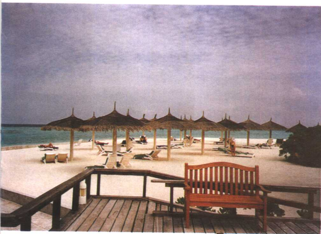
这样的休闲场所随处可见