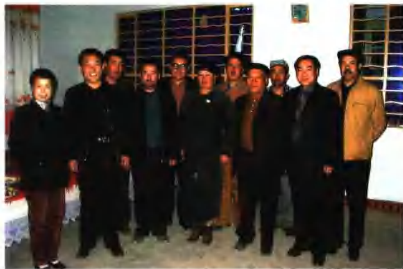
سەھىيە ئىدارىسى ۋە بىرلىك ئارزۇسى شىياھانلارنىڭ رەھبەرلىرى تەكشۈرۈش گۇرۇپپىسىدىكىلەر بىلەن بىللە.