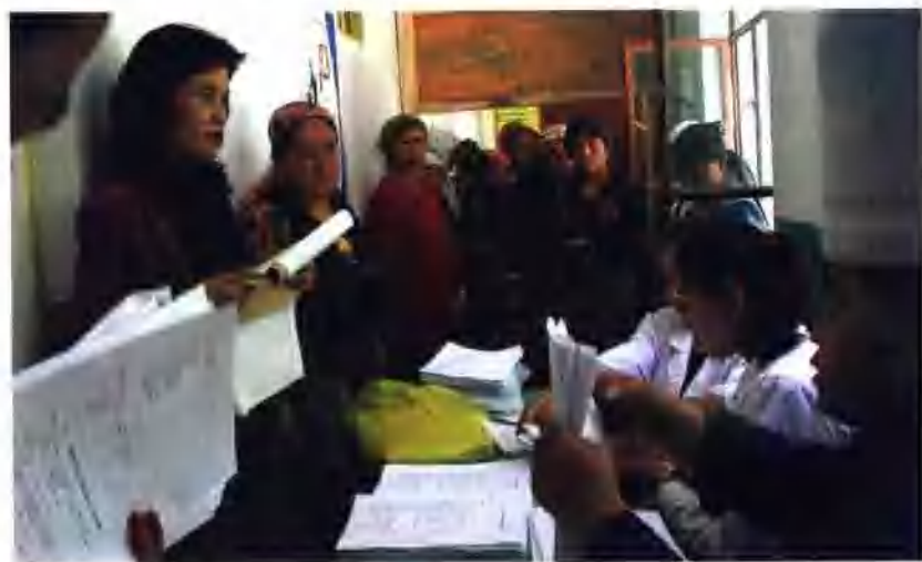
تەكشۈرۈش خىزمىتىنى يېزا-بازار رەھبەرلىرى قىزغىن قوللىدى 策勒县各乡镇领导的支持