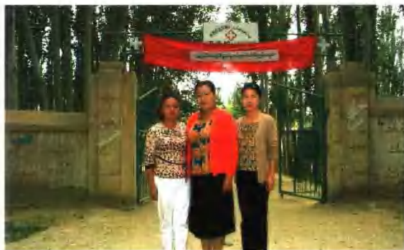
ناھىيەلىك ئاياللار بىرلەشمىسى ئۇيىدان قوللىدى