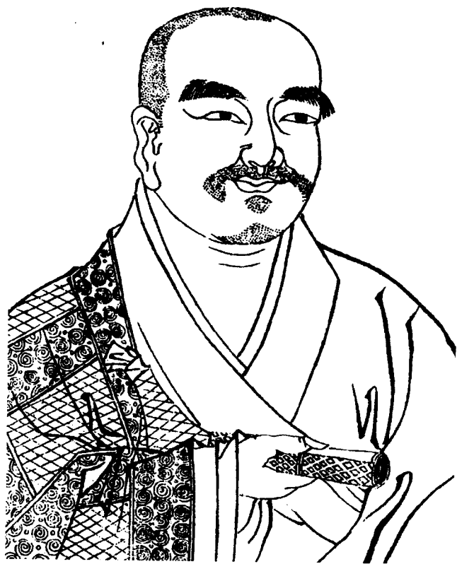
法相宗初祖玄奘法師