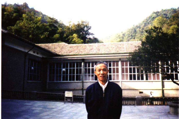
作者在韶山滴水洞考察