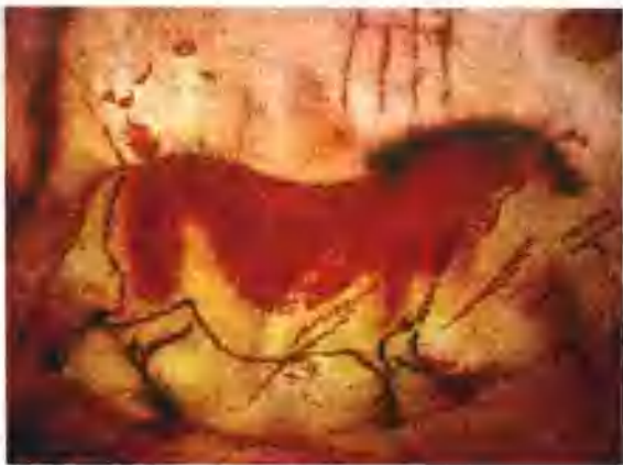
图1-1 马岩画 法国拉斯科岩洞