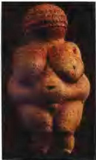
图1-3 威伦多夫的维纳斯

细细观看这件由石灰石雕制的小型人体,我们可以发现在线条的深处尚有棕色的痕迹,是颜料?还是石色?她是否也曾经用颜料涂抹过?今天的我们不得而知。如果“威伦多夫的维纳斯”真的曾经涂有色彩,那么这可称得上是迄今发现最早的石质彩塑了。历经几万年的时光洗礼,颜色褪尽无遗,今天我们所能见到的表