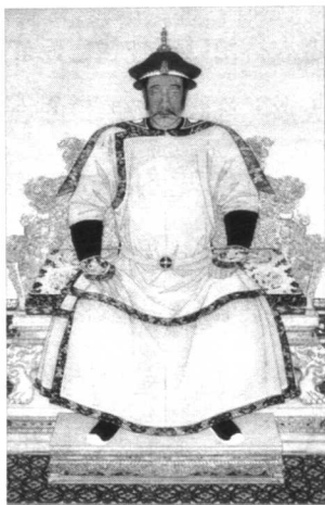
大清太祖高皇帝努尔哈赤

明万历四十四年(公元1616年)，太祖努尔哈赤建立后金汗国，建元天命。封代善、阿敏(舒尔哈齐次子)、莽古尔泰(努尔哈赤第五子)、皇太极(努尔哈赤第八子)为和硕贝勒，人称四大贝勒。此后，代善作为辅政贝勒参与国家政事，成为父汗努尔哈赤的得力助手。