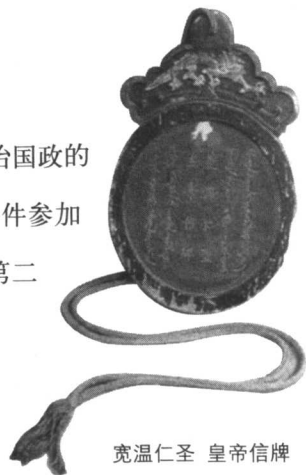
宽温仁圣 皇帝信牌

阿济格是努尔哈赤第十二子，母亲是乌拉纳喇·阿巴亥。后金天命五年（公元1620年）阿巴亥被尊为大妃，最得老汗王努尔哈赤宠爱。后金天命六年（公元1621年）正月，16岁的阿济格被列