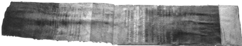
努尔哈赤登基诰命诏书

后金天命三年(公元1618年)即明万历四十六年四月，努尔哈赤以“七大恨”告天，誓师伐明。示书中指出：一是明朝军队没有缘由地出兵边外，杀害自己的祖父和父亲；二是明朝违背誓言，派兵越过边界，保护叶赫部；三是明朝违背誓言，指责建州，擅自杀死出边挖矿的汉民，并逼建州送献，十人斩首于边境上；四是明廷派兵