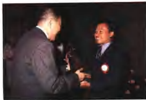
頒獎實況 最佳雜誌廣告獎—北橋廣告