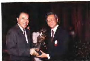
頒獎實況 最佳報紙廣告獎—聯廣公司