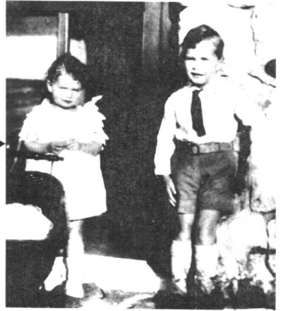
老布什与姐姐 1928 年