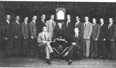
珍贵的 1947 年骷髅会合影