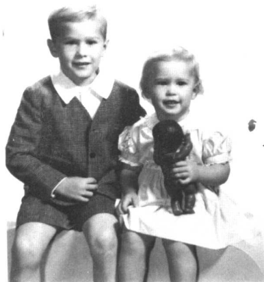
5岁的小布什和妹妹罗宾