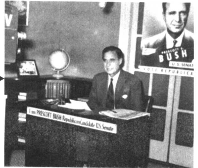
1950 年普里斯科特竞选参议员