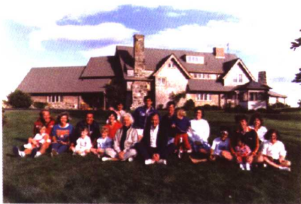
1986年8月在沃克角别墅全家合影