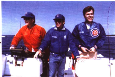
老布什与孙子在沃克角玩乐