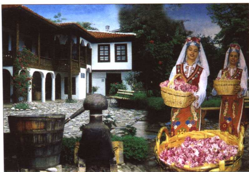
采玫瑰花的姑娘 用手工制作玫瑰油