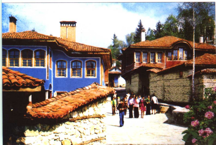
科普里什蒂查的老式建筑