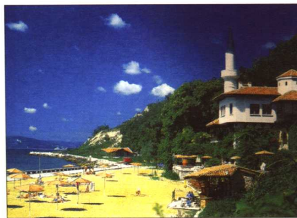
黑海海滨巴尔奇克城堡和浴场