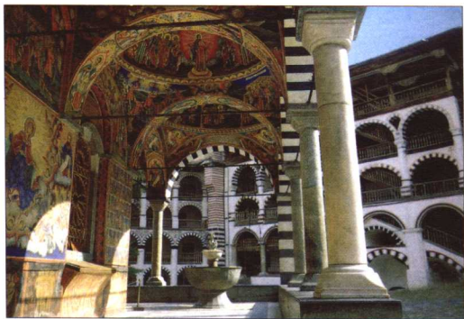
里拉修道院建筑内部