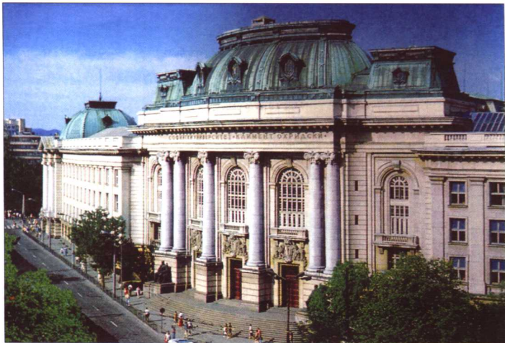
索非亚人民文化宫