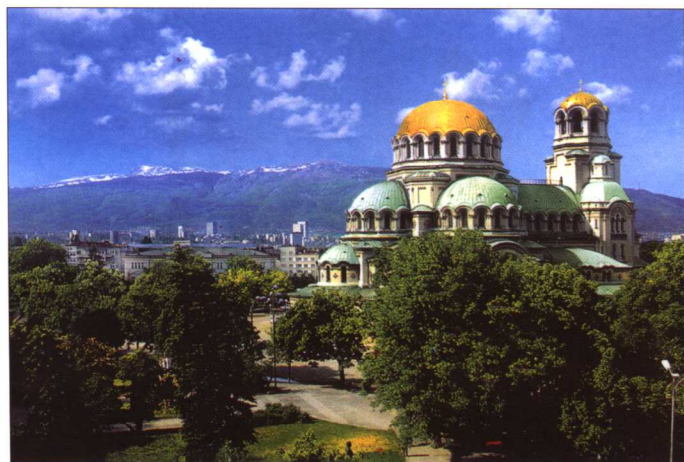
亚历山大·涅夫斯基大教堂