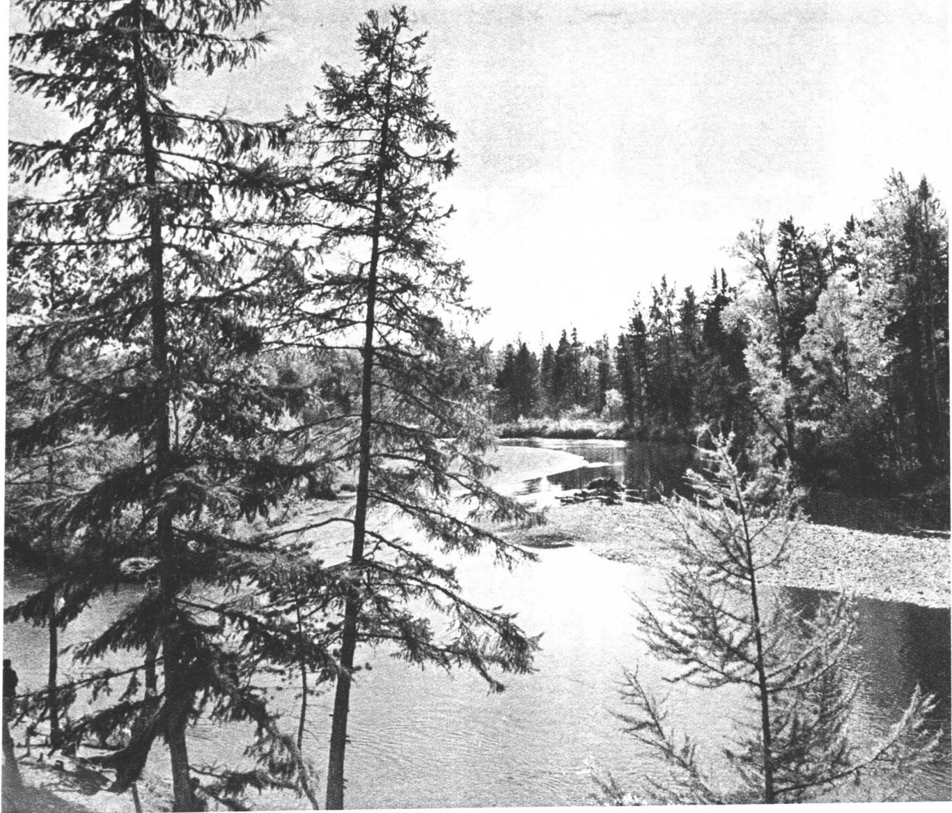
6 风光秀丽的额木河