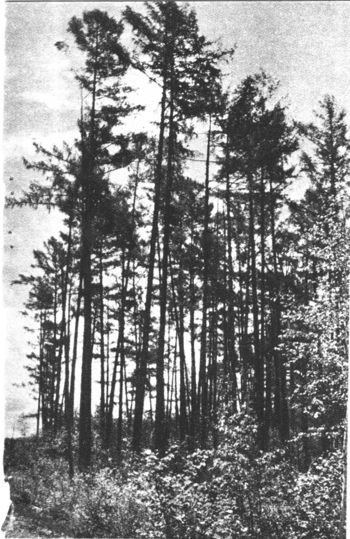
挺拔的兴安落叶松，