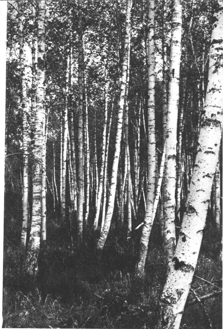
婷婷玉立的白桦林