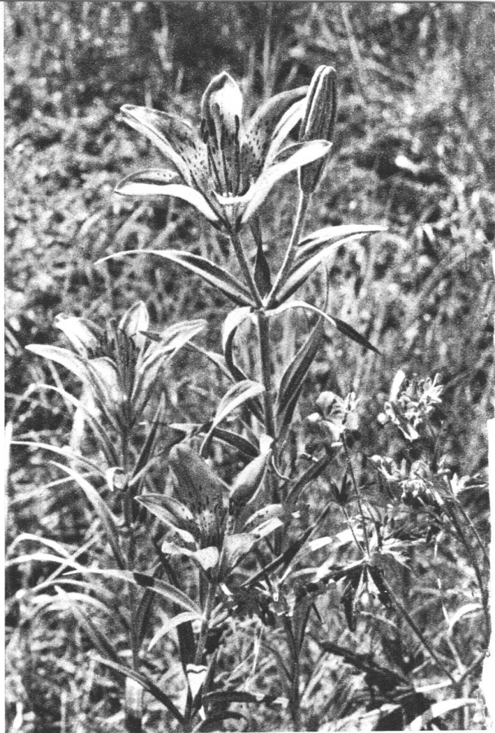
药用植物漫山遍野