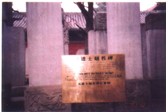
北京成贤街孔庙内元、明、清进士题名碑