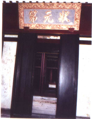
清状元翁同龢故居墙门内之状元匾(原件)