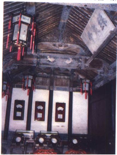
清状元翁同龢故居第三进主厅采衣堂