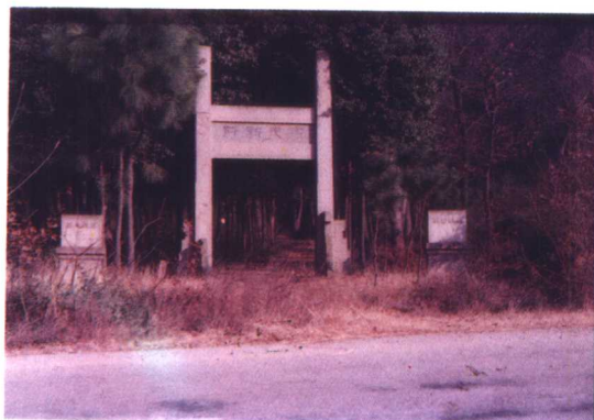
虞山西麓鹤鸽峰之翁同龢墓道