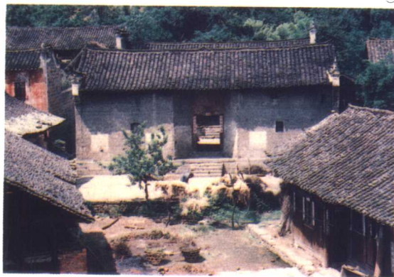
清状元夏同龢故居