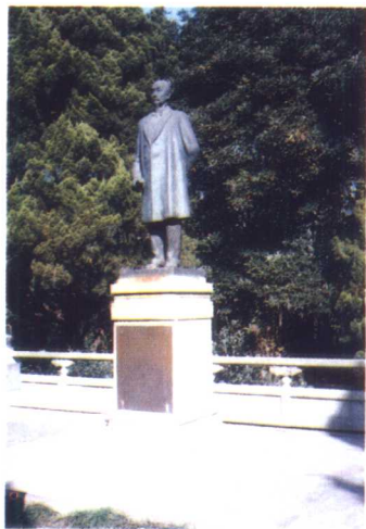
清状元张謇先生铜像矗立在南通南郊蒿园内