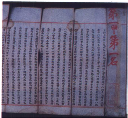
明状元赵秉忠殿试卷