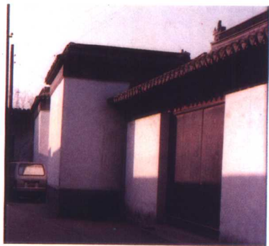
清状元翁同龢故居正门(常熟翁家巷门2号)

(翁同龢纪念馆朱育礼供稿) 翁氏丙舍是翁同龢晚年隐居的地方， 即「瓶隐庐」(在西门外虞山鹤鸽峰 祖茔旁祠堂内)