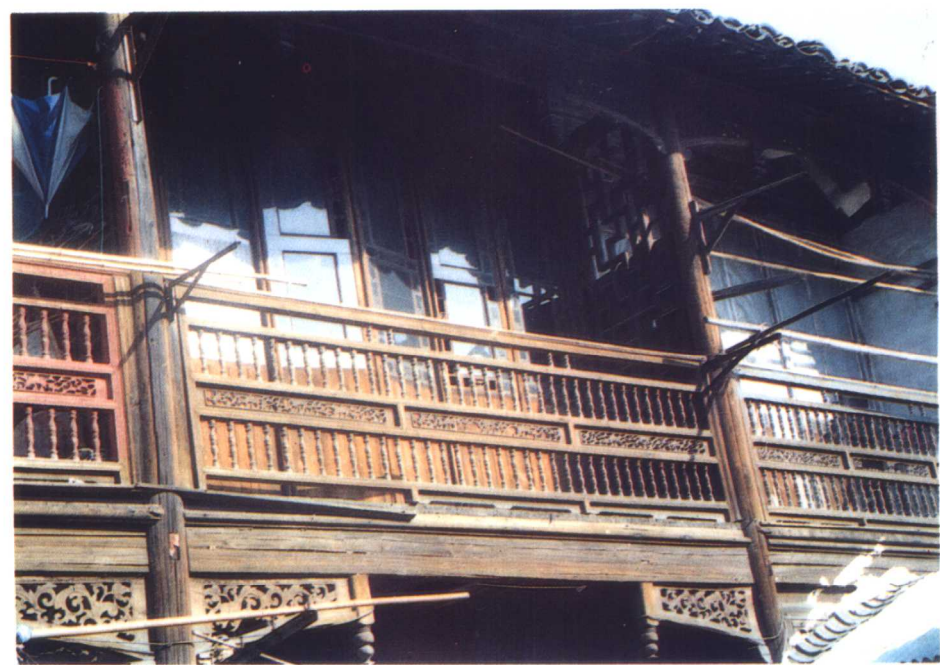
清状元陆润庠故居