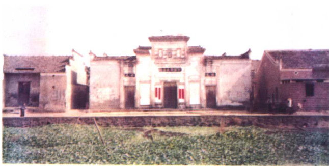
明状元彭时故里 “状元祠”