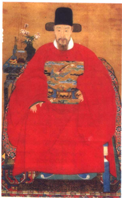
明状元赵秉忠画像