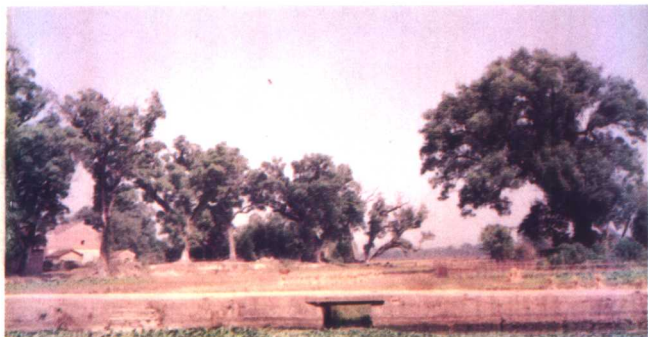
明状元彭时故里 “状元樟树林”，相传为 彭时状元及后率家乡 村民所植