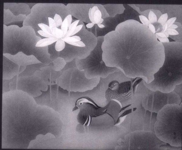
詹前裕 河塘鴛鴦 1994年 膠彩・絹本 72×91cm 私人藏