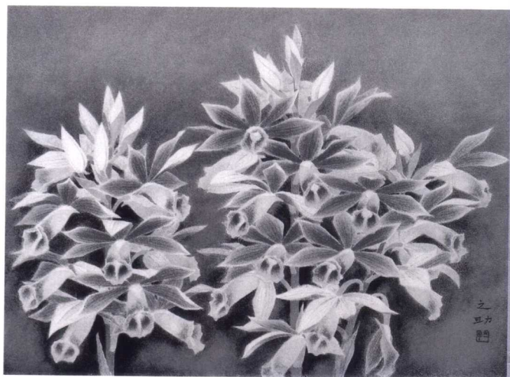
林之助 鶴蘭（1） 1981年 紙・膠彩 45×33cm 台中縣立文化中心典藏

就某方面而言，過分地執著於「東洋畫／日本畫／國畫／膠彩畫／岩彩畫」的名稱是頗為無謂的。關於它在不同時期的不同名稱，除了若干章節的討論需要外，本書一律稱之為「膠彩畫」。