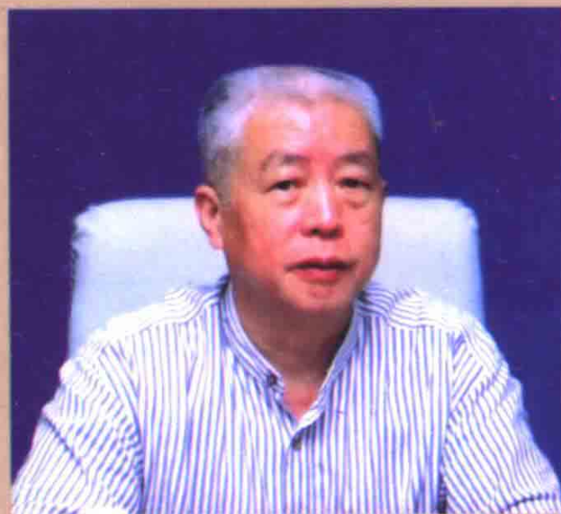
徐杰舜 教授，浙江余姚人，中南民族大学人类学研究所所长，中央民族大学博士生导师，广西民族学院汉民族研究中心主任，中国文学人类学研究会副会长，中国都市人类学会副秘书长，中国民族理论学会常务理事，英国华夏文化协会荣誉顾问。