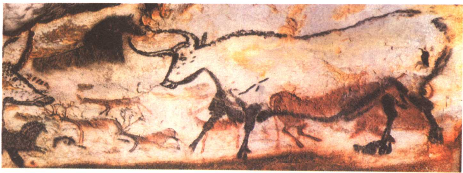
拉斯科山洞岩画(局部) 距今约2.5万年 法国

有什么内在的联系，可是各有章法，纹丝不乱。图中看到的这头《野牛图》被画在主洞的窟顶上，经研究发现，是通过先涂色、后勾线的方式绘成的，野牛线条粗犷，结构科学，运用了多种颜色，其中以赭红与黑色为主，辅助有黄色和暗紫色。经研究发现，所用的“颜料”主要是来自天然矿物研磨出来的各种粉末以及燃烧后的黑色木炭，其中还夹杂有动物的油脂和血液。而他们的画笔可能就是一种苔藓类植物或者兽毛等。这头野牛画像准确的身体比例、丰富的色彩，充分显示出了史前人类对于动物形象的精熟和多种色彩搭配运用的技艺，在绘画技巧上是一大进步。