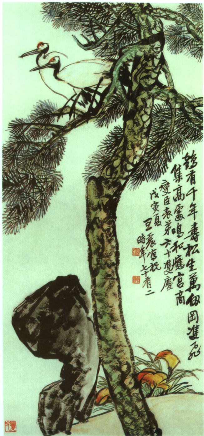
松鹤延年 1938年 140 × 66cm