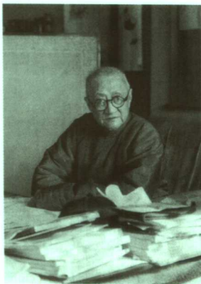
王一亭照 (1935年摄于“梓园” 二楼大堂画室)

王一亭是一位勤奋的画家，传世的作品相当多。即使经商工作忙碌，他仍是“每日作画甚勤，清晨六时起床，挥毫至上午十时，始出门办公，寒暑无间” ① 。现在传世最早