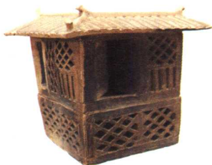
东汉干阑式建筑陶屋