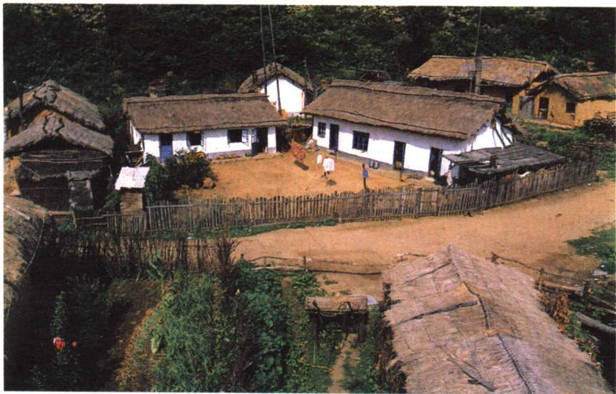
黑龙江朝鲜族水泥抹面墙体民居

河南偃师二里头建筑遗址中，也有高出地面的台基遗迹。如位于第三发掘区内的一处台基，呈东西走向的狭长条状，东西长约28米，南北只有8米左右。台基现残存夯土厚在0.16~1米之间。此处遗迹不但有台基，而且在台基上有木骨泥墙环绕分隔，成为三间建筑形式，这表明穴居形式已发展到了地面分室建筑阶段。