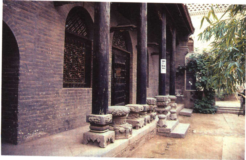
河南康百万庄园砖砌窑洞

山西夏县东下冯村二里头文化居住遗址，位于山西夏县东下冯村东北。据推断，其营建与存在时间应在夏代中、晚期及商初。遗址面积达25万平方米，房屋形式有半地穴、窑洞和地面建筑三类，以窑洞形式为最多。窑洞都是依靠黄土崖或沟壁开凿而成，