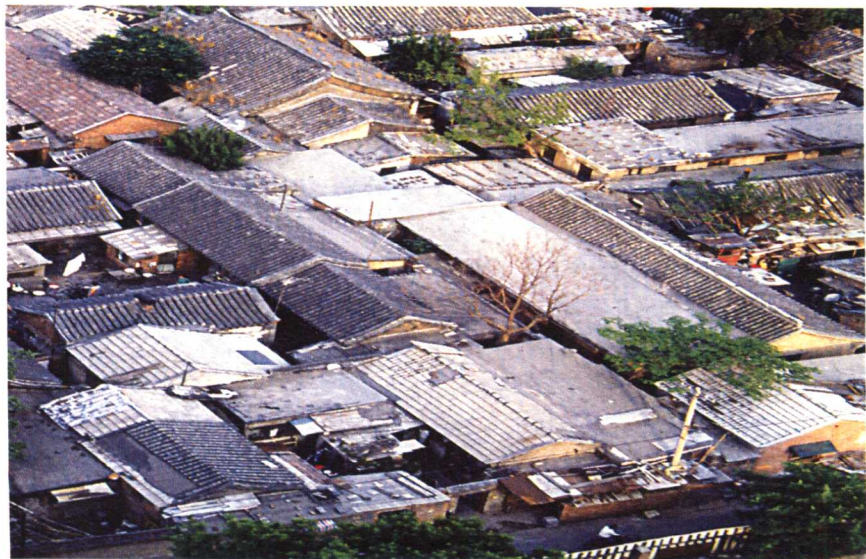
北京四合院民居群

外地州县与乡村住宅自然属于民居最低等级。北方建筑大部分为夯土垣墙，上加木屋架，或盖瓦，或铺茅草；江南地区建筑则较多用茅草或竹苇，不过后来因茅草易发生火灾而有所改变，这在《旧唐书》与《新唐书》中均有相关记载。《旧唐书·宋