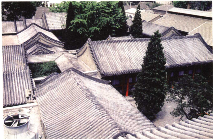
北京某四合院民居

由此，联系整个中国古代建筑发展史，汉代当属中国封建社会建筑发展的第一个高峰，后来的隋唐则是第二个高峰。秦汉与隋唐之间的三国、两晋、南北朝时期，则属于两高峰之间的过渡期。这一时期除对汉代建筑的继承与发展外，还因国家大部分