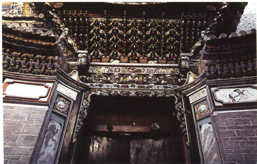
云南大理某民居精美的门楼

井干式构架用原木嵌接成框状，层层叠垒，形成墙壁，上面的屋顶也用原木做成。这种结构较为简单，所以建造容易，不过也极为简陋，而且耗费木材。