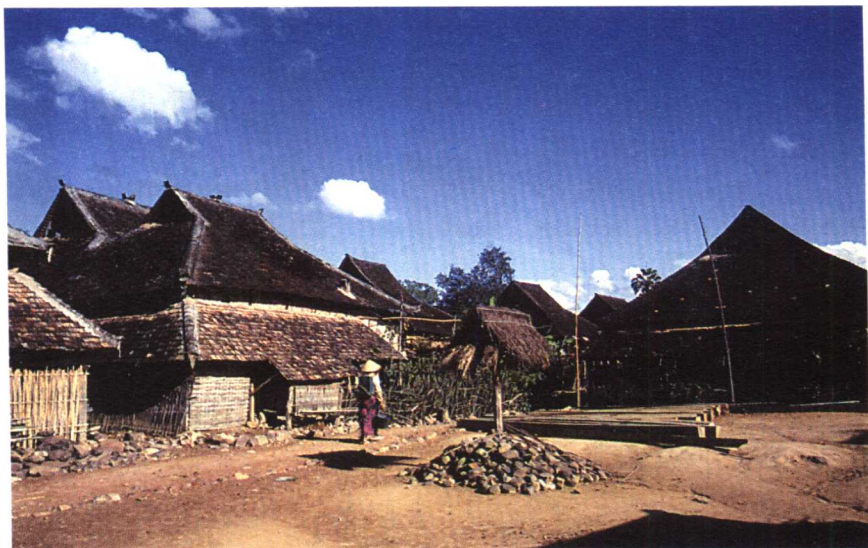
云南西双版纳傣族干阑民居