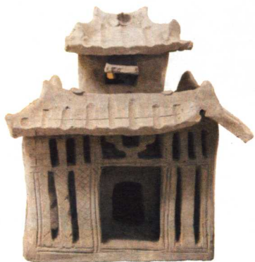
东汉用于防御性的陶屋