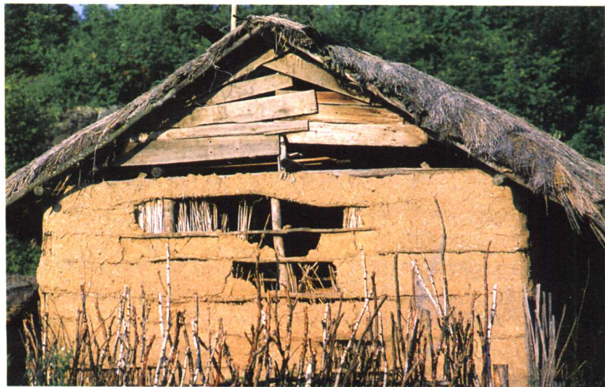
黑龙江朝鲜族茅草顶、土墙民居

山西夏县东下冯村商代聚落遗址，原建于夏代中期，商代时被继续使用，并有所增修与扩建。这一聚落的外围是宽达8米的夯土墙，基本已包纳了原有的二重濠沟。此外，还发掘有十多处成行排列的基址。基址高出地面30~50厘米，形成一个个凸起的台基，台基的直径多在8~10米之间。台基的中心有一个直径约30厘米的大柱洞，边缘则环列有几十个较小的柱洞。建筑下面有凸起的台基，表明建筑已完全脱离了原始的穴居形式。