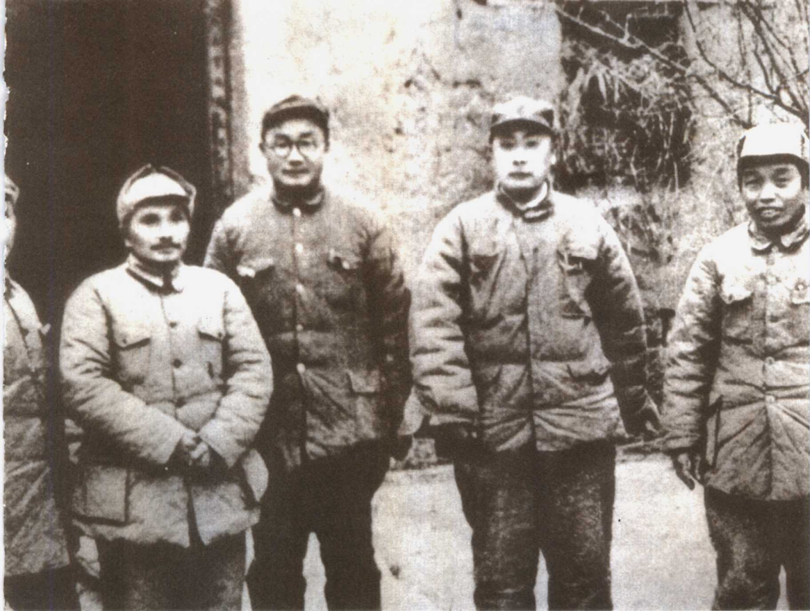
■ 淮海战役总前委合影。左起：粟裕、邓小平、刘伯承、陈毅、谭震林。

毫无例外地，大家不再相信现政府能够加强而恢复人民尚可忍受的生活水准……蒋介石将不可避免地经过相当时期而被抛弃。”紧接着司徒雷登正式向马歇尔提出了请蒋介石下台的建议。