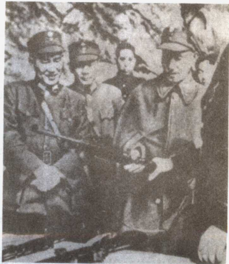
■ 1945年抗战胜利后，蒋介石在察看美国赠送的武器。

在对日作战中，美国罗斯福政府也曾把中共领导的武装力量视为盟军，当时许多美国援华人士认为八路军、新四军在敌后收复了很大一片中国的国土，对抗日是真诚而英勇的；他们甚至为中国战区统帅蒋介石把美国援华的大量物资不分配给中共的军队愤怒得提出严重抗议。