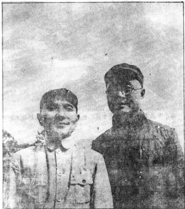
刘伯承司令员、邓小平政委南征前合影