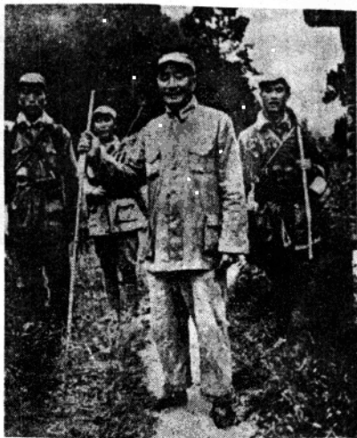
刘伯承司令员登上山角视察地形