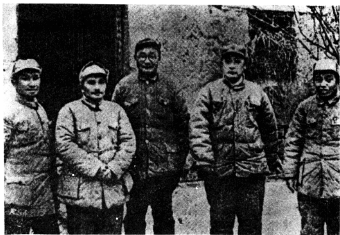
淮海前线总前委合影