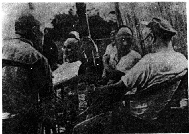
刘伯承同志和陈毅、邓子恢、李达同志