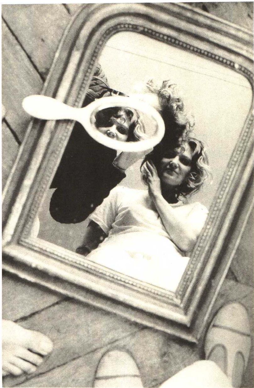
无题 丹尼斯·罗彻 (Denis Roche) 1978