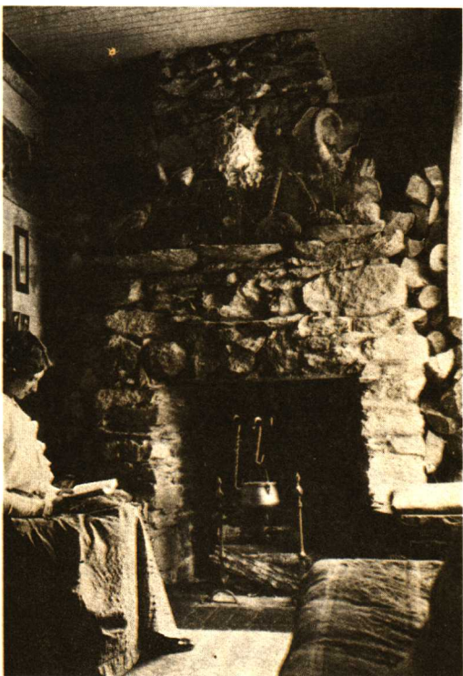
还未成为伊丽莎白·雅顿的弗洛伦斯·南丁格尔在她加拿大的家里。

从小的时候，每当家里的马生病了，或是哪个孩子不舒服了，都是由弗洛充当医生的角色。因此，所有的人，包括小弗洛自己都相信，她有一双神奇的手。因此，在她找工作的时候，弗洛想也没