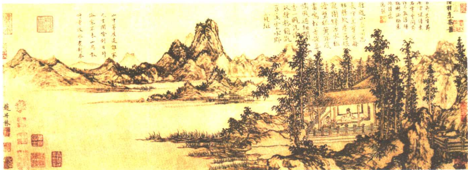
陆羽烹茶图 赵原（元）