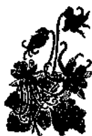
插图 崔开重 張国宝