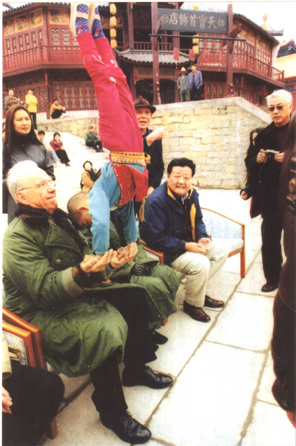
■ 1998年春，默多克先生在刘长乐的陪同下，来到了广东南海的一个影视基地。默多克这手“掌上倒立”功夫博得众人喝彩。