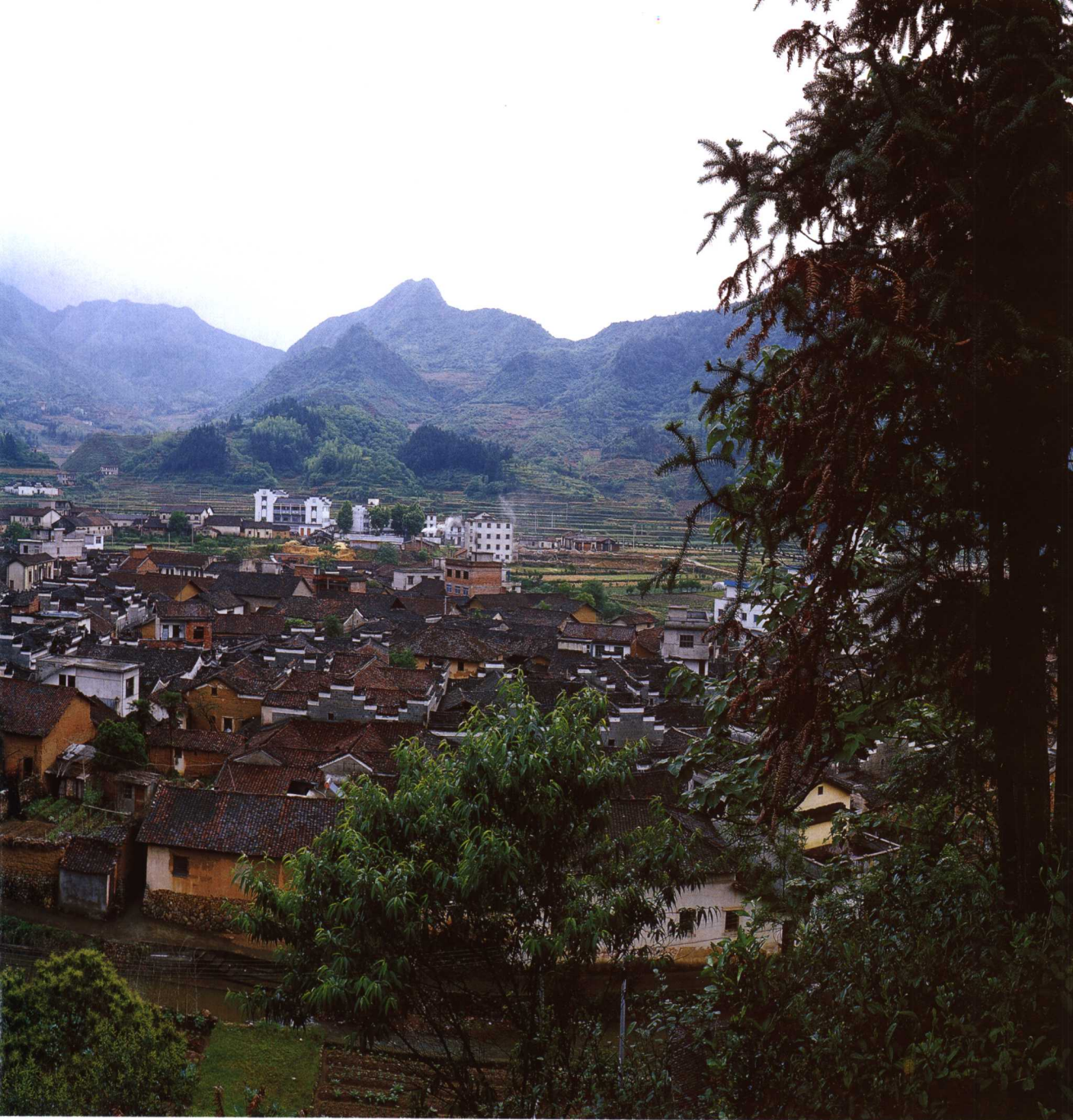
▲ 廿八都——一个遗落在大山的梦