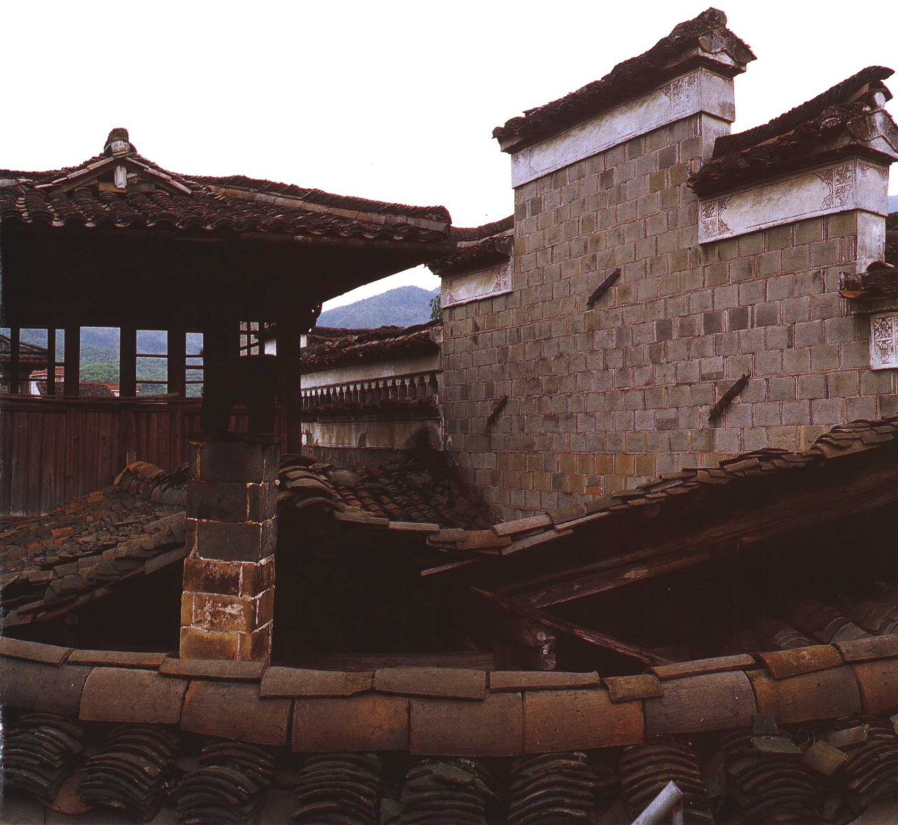
▲高墙古瓦，守着千年的沧桑。