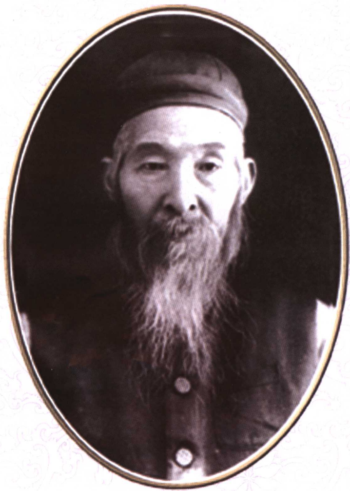
现代武术大师孙禄堂像