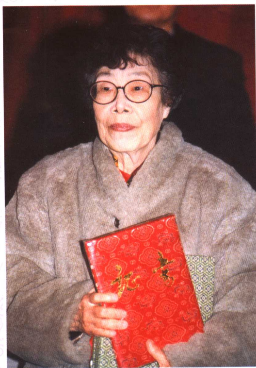
荣获“全国十大武术名师”称号