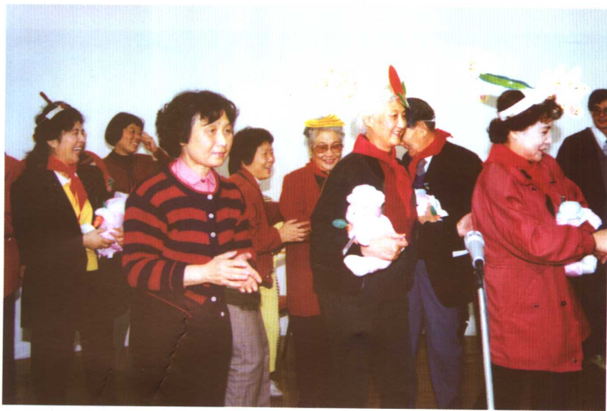
著名表演艺术家们沉浸在优化的情境中 (前排右起：秦怡、黄宗英、李吉林、赵青；后排中：张瑞芳)