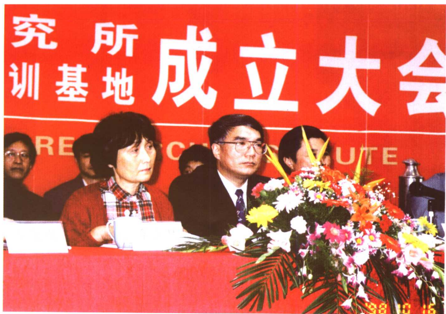
江苏情境教育研究所成立得到江苏省、南通市领导和诸多学者的支持 (1998年10月；中为江苏省人民政府王珉副省长)