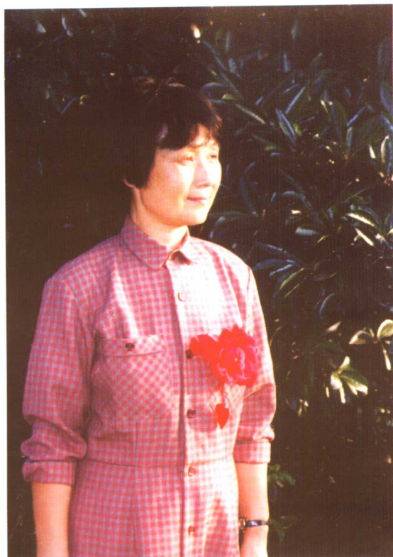
带着实验成功的喜悦，到北京参加全国劳模会（1989年国庆节）