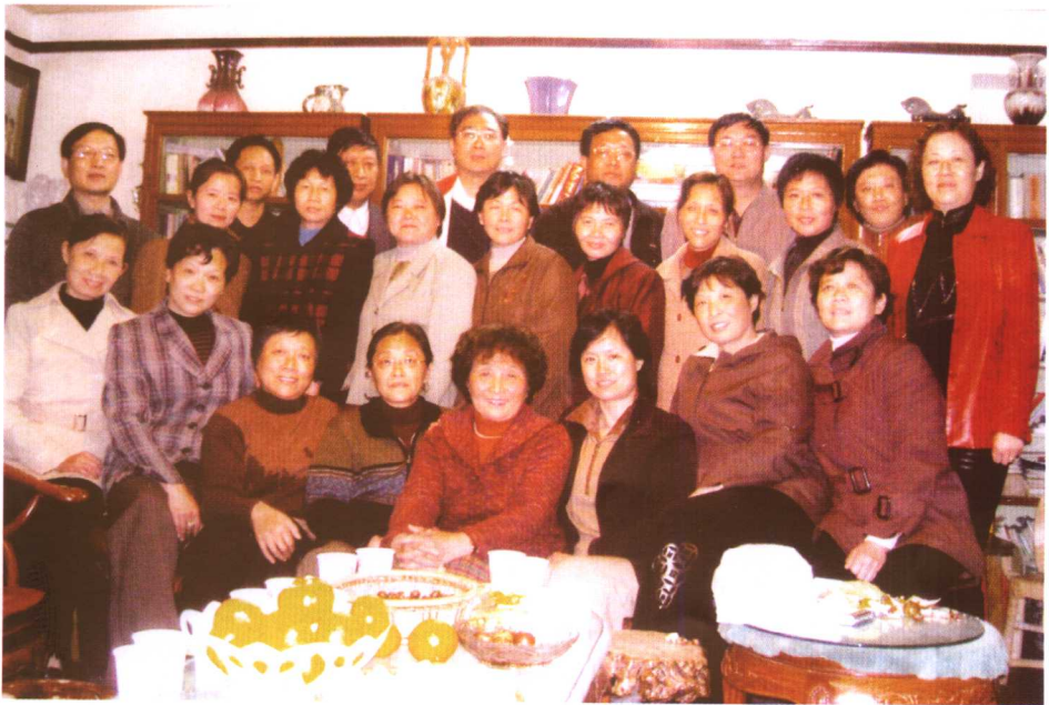
40年前的学生来家中看望老师（2005年秋）