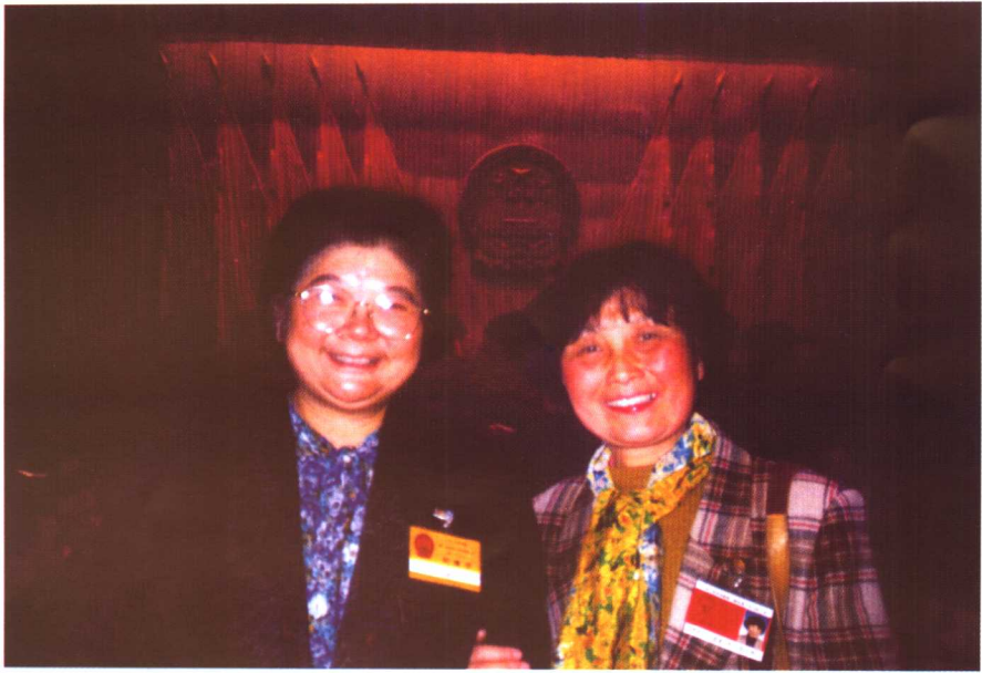
与全国人大常委会顾秀莲副委员长（原江苏省省长）在人民大会堂合影