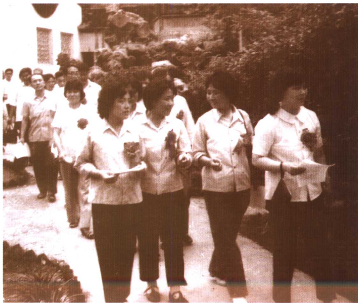
对中国第一位电子学女博士韦钰（前排左二）充满仰慕之情（1982年，在江苏省劳模会上）