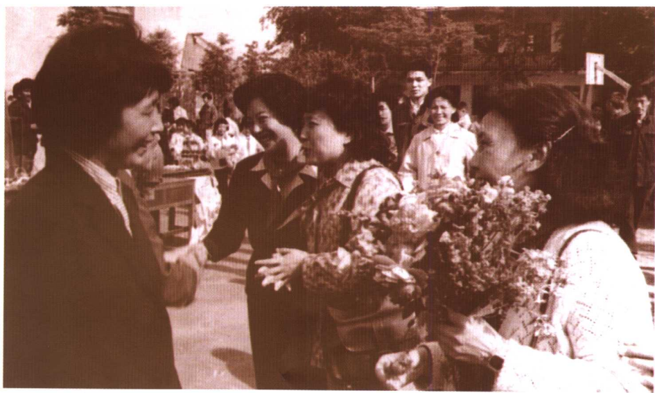
为了孩子们的活动迎接著名表演艺术家（右一为白杨；1982年6月1日）