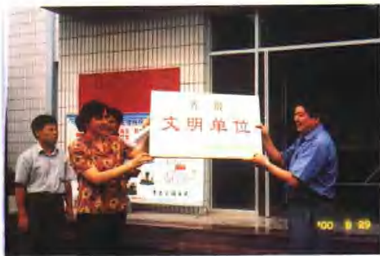
历下区环卫局获省级文明单位荣誉称号。