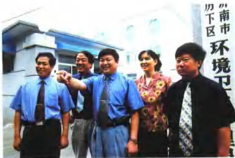
团结奋进的历下区环卫局领导班子。