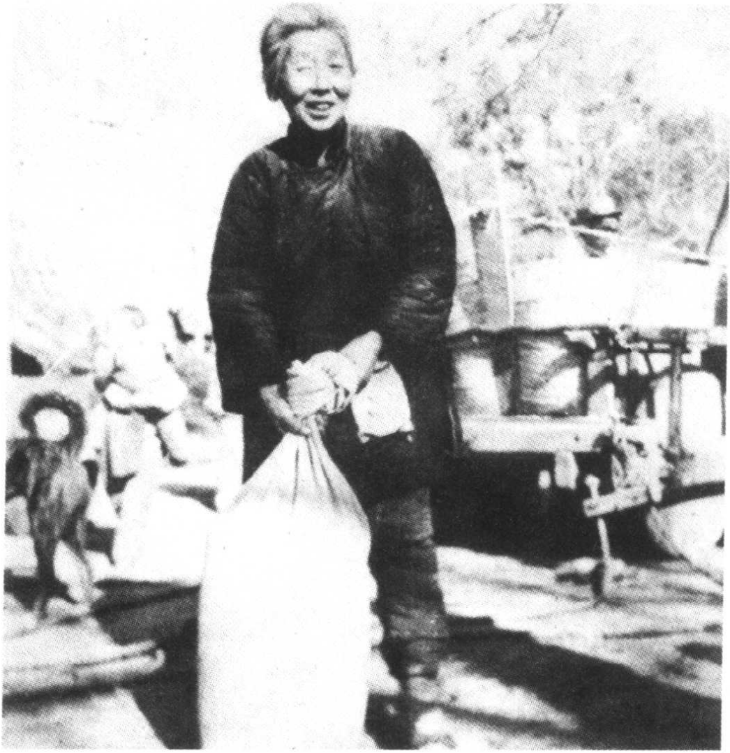
被解放的许昌老大娘分到粮食后的喜悦