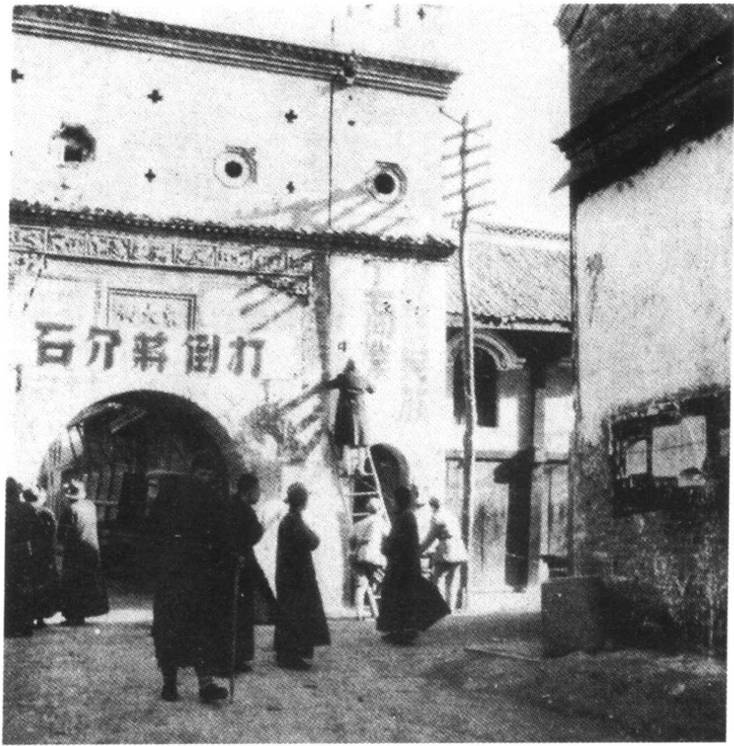
解放许昌的部队在宣传城市政策