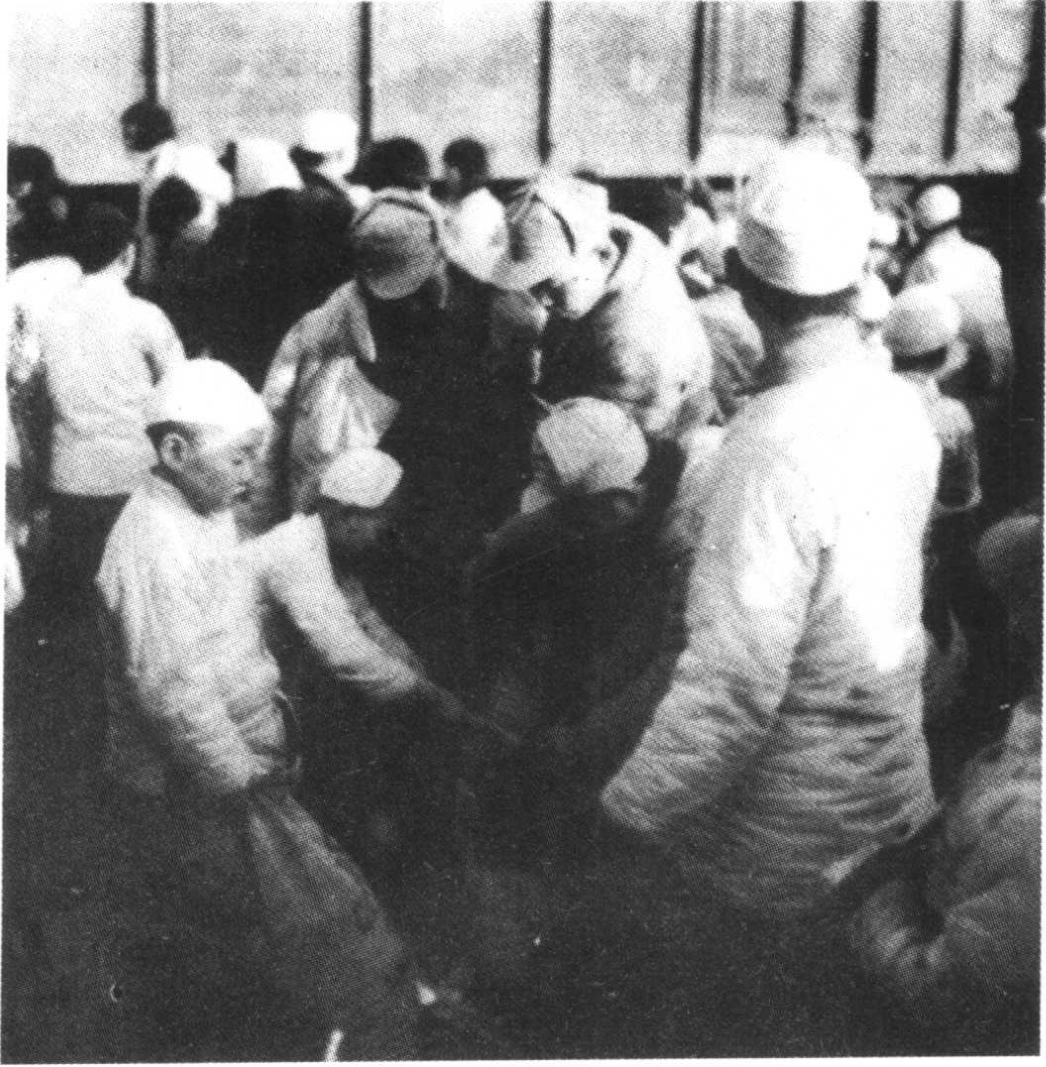
解放许昌的部队在开仓济贫