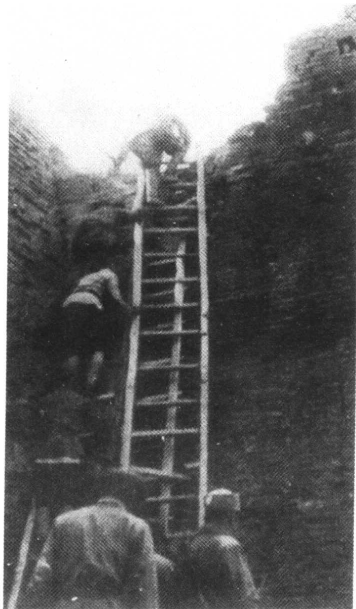
解放军突破安阳城垣