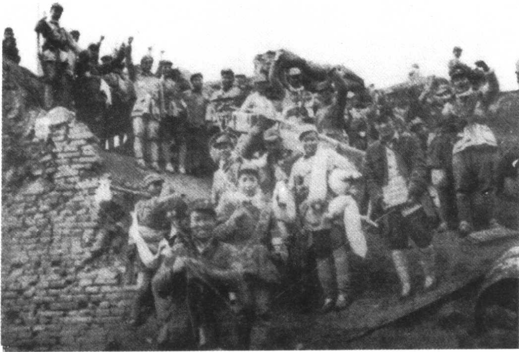
1947年5月,豫北战役中解放军攻克汤阴县城后在欢呼胜利