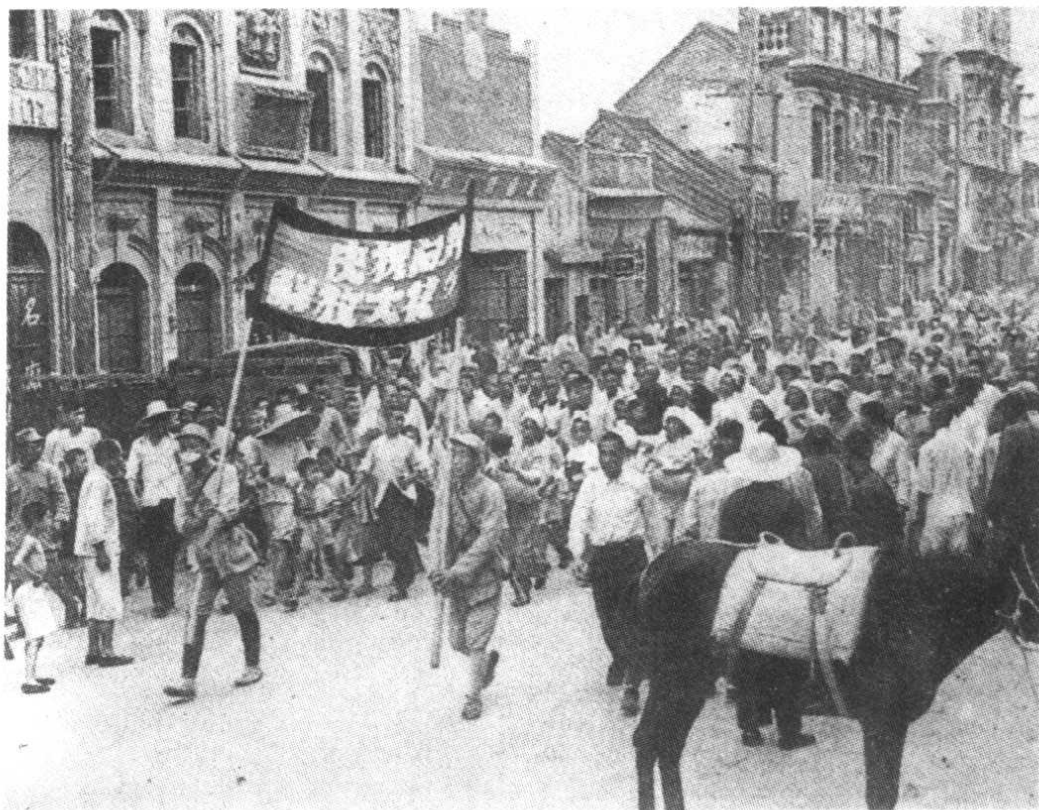
1948年6月,人民解放军第一次解放开封