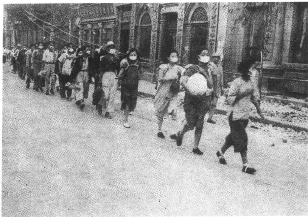
开封解放后,大批知识青年奔赴解放区