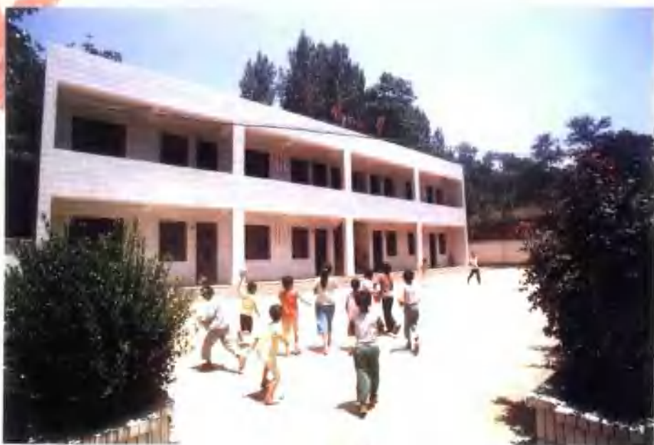
范里镇大峪村小学