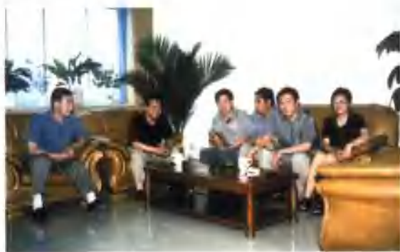
1999年8月，财政局班子成员在研究工作。