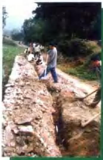
河口湾组人畜引水工程