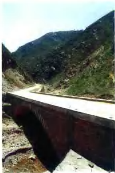
范里镇大峪村通往姚家山桥