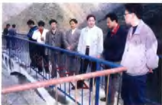
省市县领导到双庙水库检查粮食自给工程