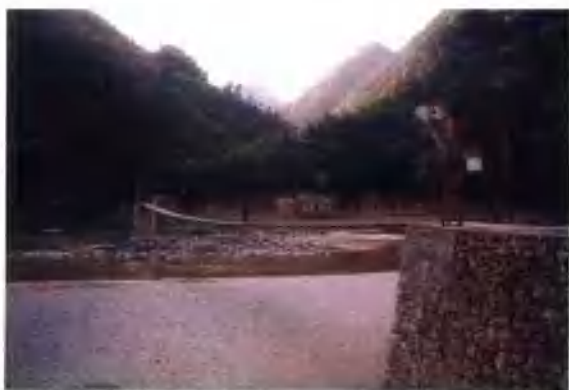
徐家湾乡良木村吊桥