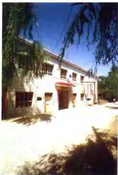
狮子坪乡山岔村小学