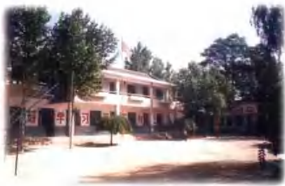
东明镇火爨村小学