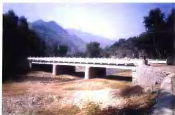
木桐乡拐玉村大桥