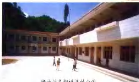
狮子坪乡柳树湾村小学