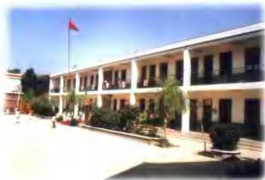
东明镇祁村湾小学