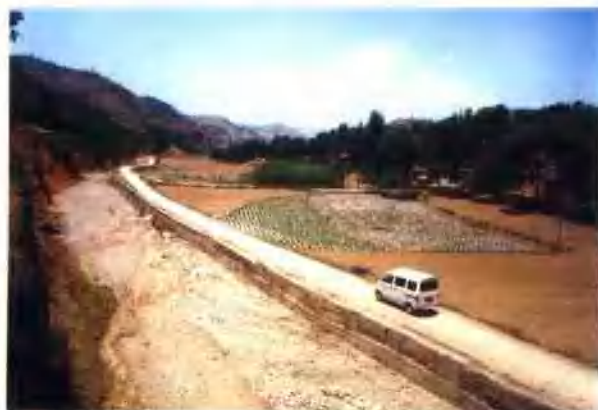
范里镇大峪村改河造地工程