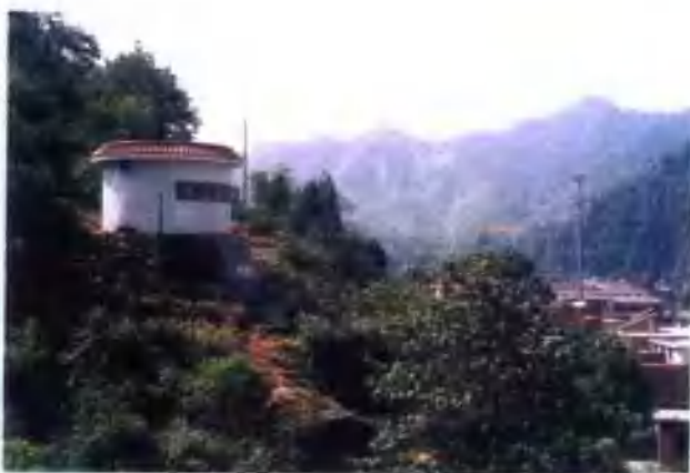
双槐树乡九龙洞引水工程