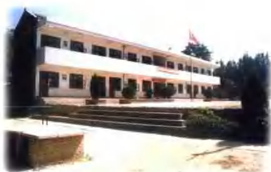
东明镇北苏村中学