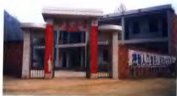
朱阳关镇岭东小学