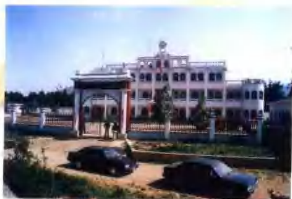
官道口镇蒋槽村小学