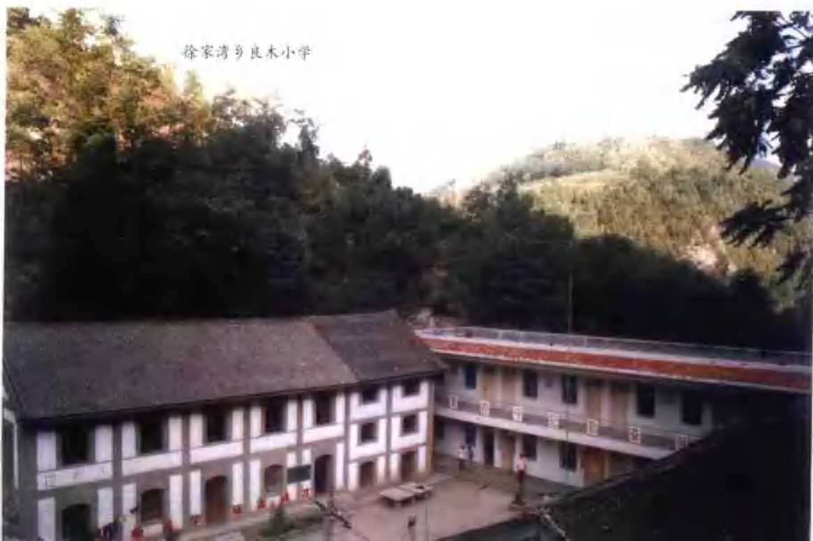
徐家湾乡良木小学