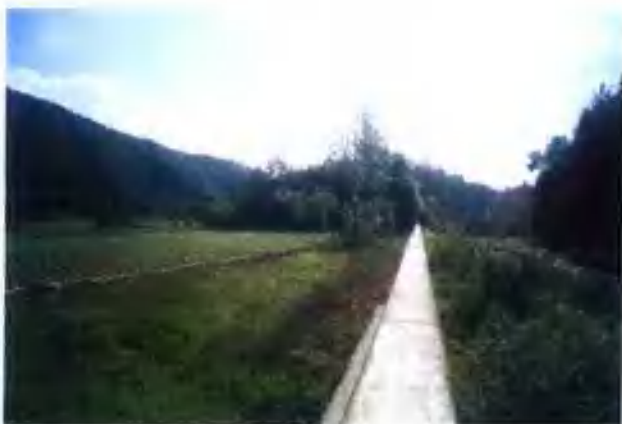
瓦窑沟纸槽改河造地工程