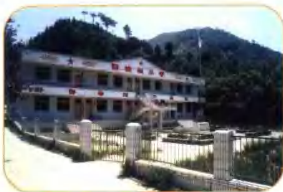
范里镇阳坡根小学