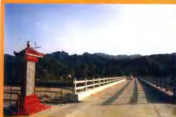
朱阳关镇鹤河大桥