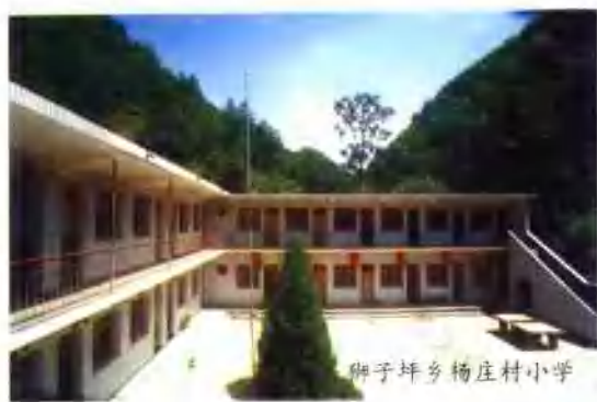
狮子坪乡杨庄村小学