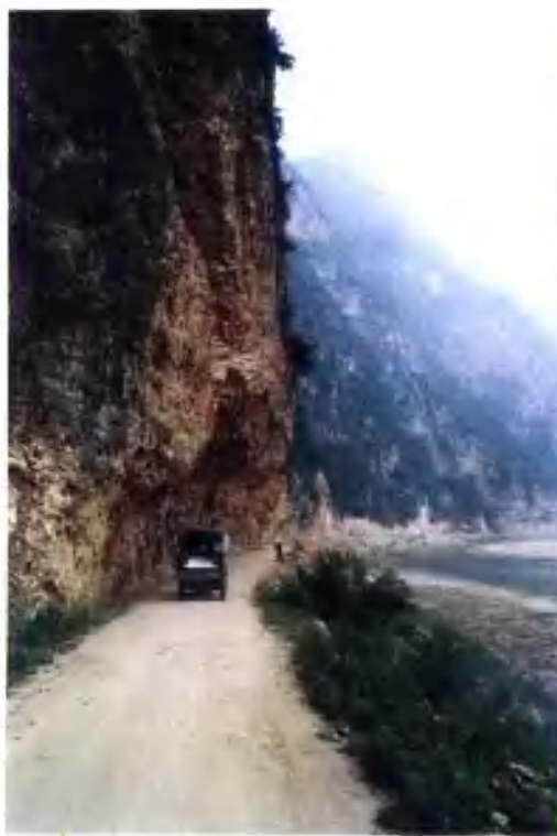
徐(家)洛(南)出境公路青崖壁段