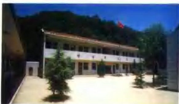
狮子坪乡花园寺村小学