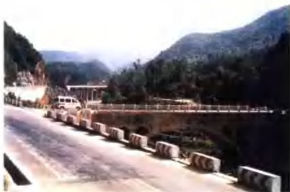
瓦窑沟乡两岔河桥