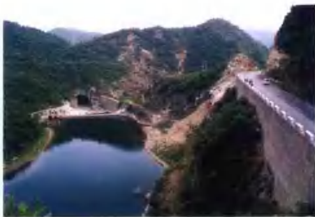
瓦窑沟乡泉坪村寨子堰水库