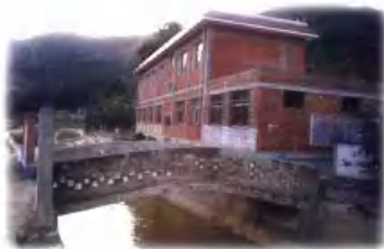
徐家湾乡庄子村小学