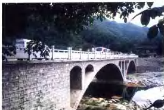
瓦窑沟乡上河村大桥