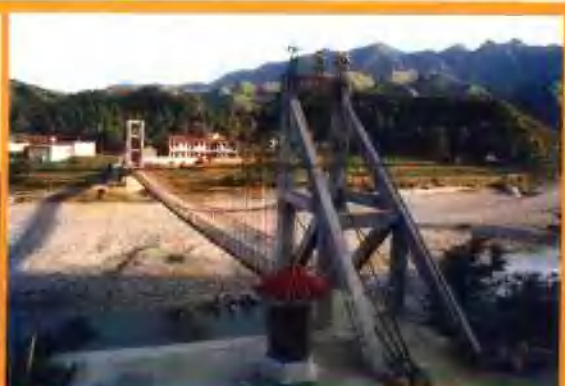
朱阳关镇莫家营鹤河“富民桥”