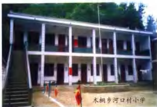
木柵乡河口村小学