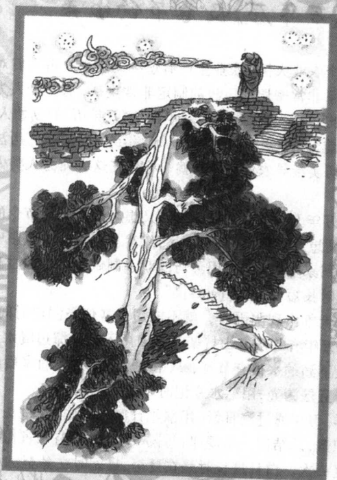
《万年历》及春节的由来