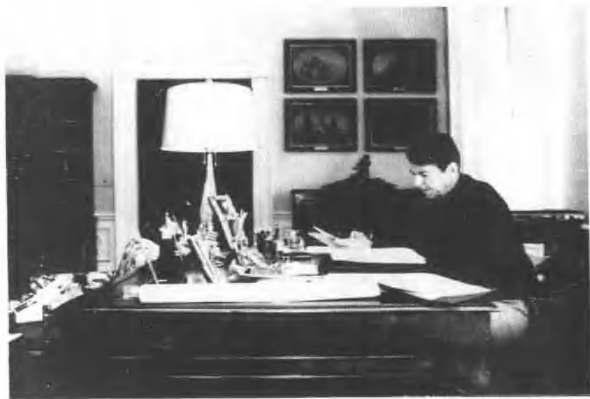
在白宫书房伏案工作