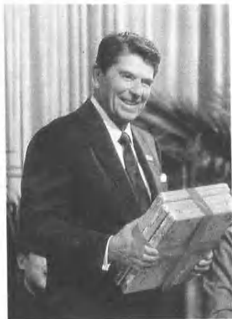
1984年4月30日在 上海复旦大学