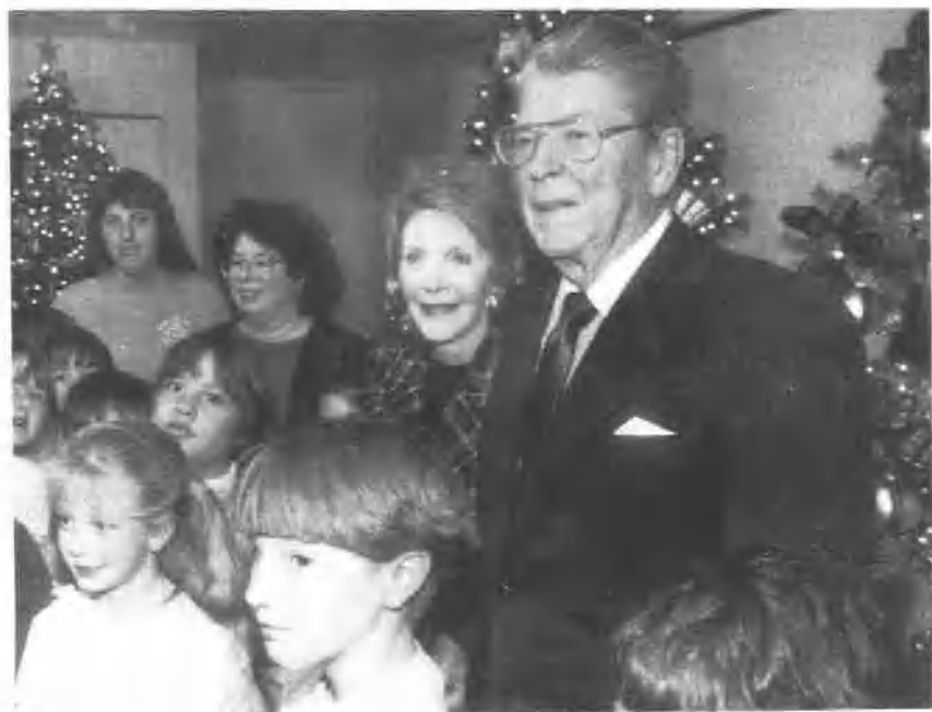
被确诊患老年痴呆症以来首次公开露面