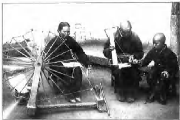
△ 祖孙学文化(1957年)。