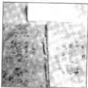
△ 列宁小学课本。