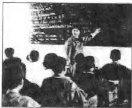
△ 列宁小学教师管梅荣给学生讲课。