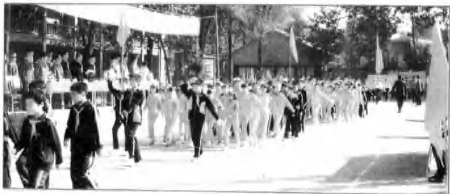
△ 城关中小学举行中国少先队建队40周年庆祝活动