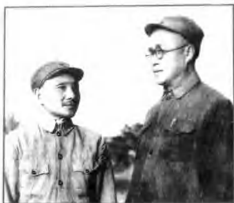
◁ 1947年8月晋冀鲁豫野战军挺进大别山时，刘伯承、邓小平二位首长留影。