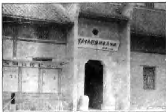
△ 中共中央鄂豫皖分局旧址