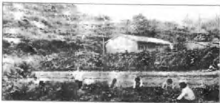
△ 戴嘴乡农业初中学生在实验基地实习。