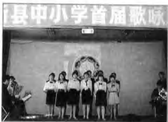
◁ 1991年5月4日,县委宣传部、教育局、文化局、团县委在电影院联合举办新县中小学歌咏优秀节目汇报演出。