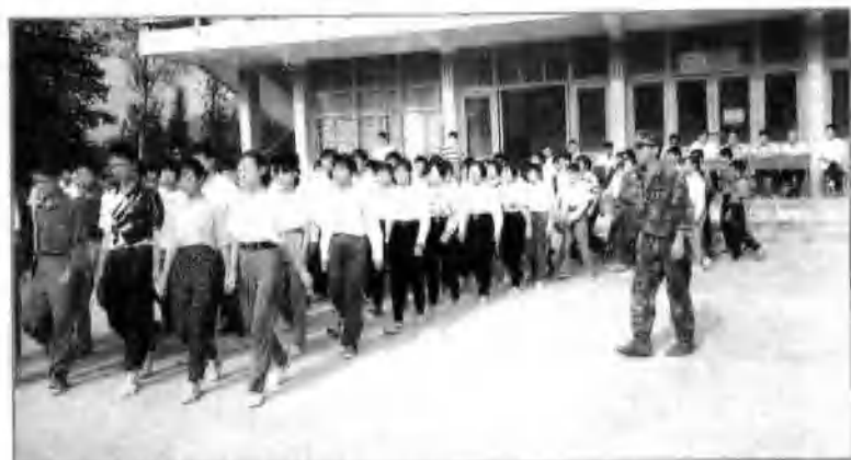
△ 县职高新生受军训。