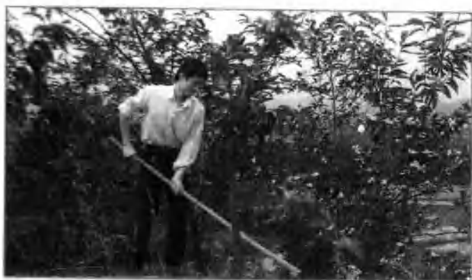
△ 县职高毕业生在承包的荒山上。