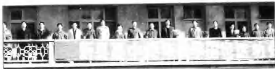
△ 1992年新县高中秋季田径运动会教育局、体委领导在主席台上。