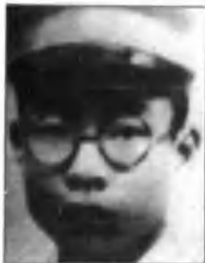
蔡申熙——红二十五军军长、彭杨军政干部学校兼校长。