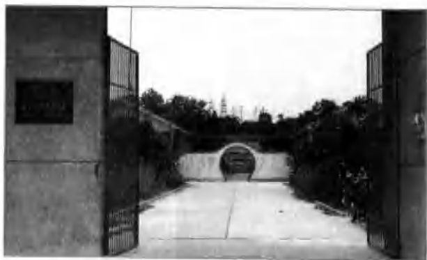
新县教师进修学校▷