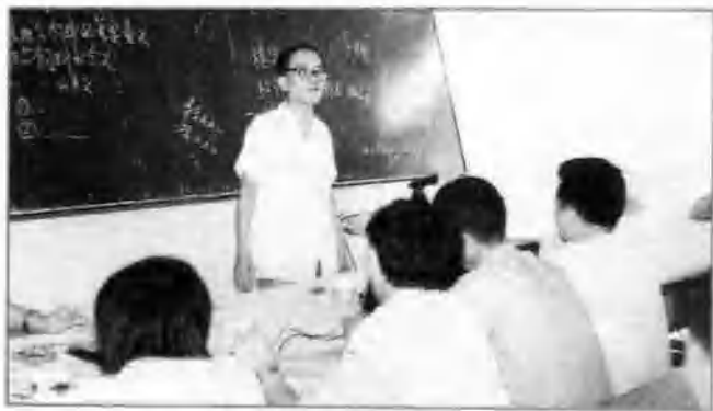
△ 河南农大教授在县职高讲课。