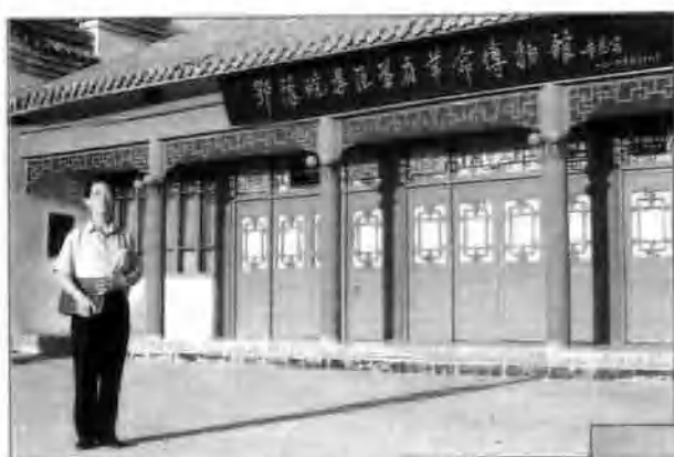
◁ 省、地、县德育基地 ——鄂豫皖苏区首府革命 博物馆。