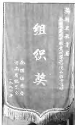
△ 1994年，“爱我中华，爱我家乡”读书竞赛活动全国组委会、河南省组委会授予教育局组织奖。