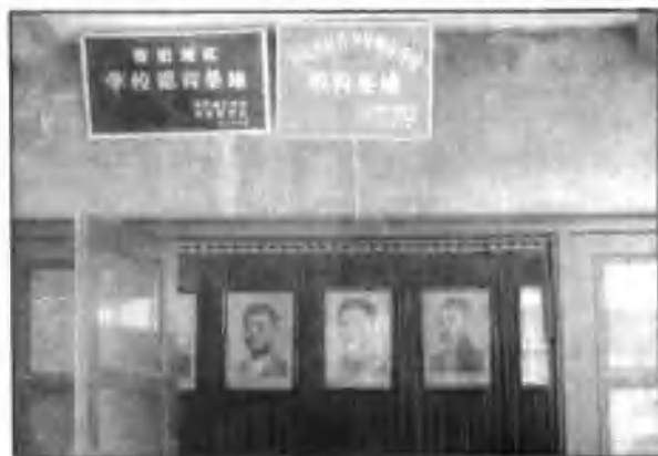
◁ 鄂豫皖苏区革命烈士陵园陈列室