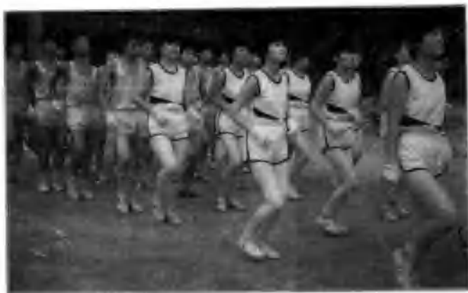
△ 1992年新县高中秋季田径赛。