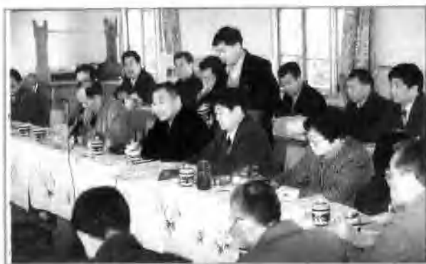
△ 1995年4月,省政府扫盲验收工作队在听取扫除文盲汇报。