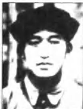
吴焕先——红二十五军军长、政委，新县列宁小学创始人、烈士。