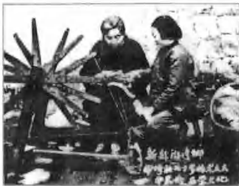
婆媳学文化(1957年)。 ▷