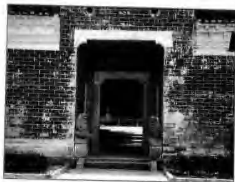
△ 鄂豫皖区黄安县苏箭厂河(今属新县) 列宁小学旧址