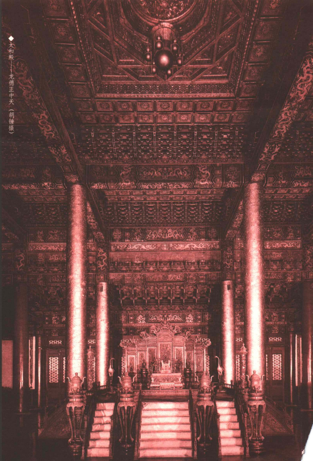
◆太和殿——龙德正中天