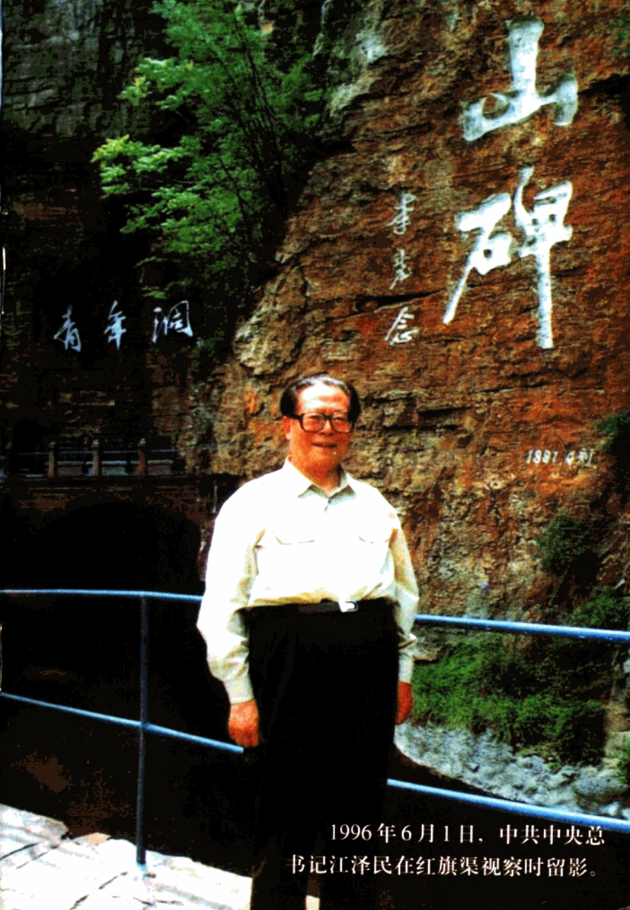
1996年6月1日，中共中央总书记江泽民在红旗渠视察时留影。