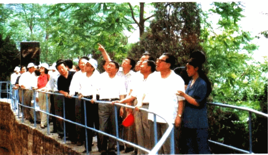
1997年5月25日，全国人大常委会委员长乔石视察红旗渠