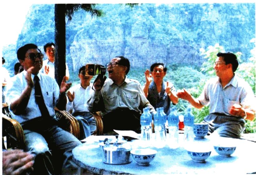
江泽民总书记在青年洞小憩时带头放声歌唱《在太行山上》