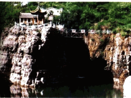
络丝潭风景区一角