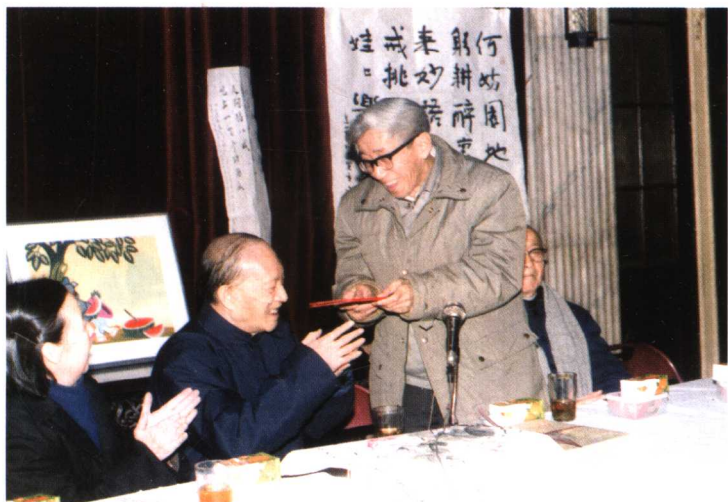
著名动画专家、原上海美术电影制片厂厂长特伟（右一）向包蕾颁发证书。