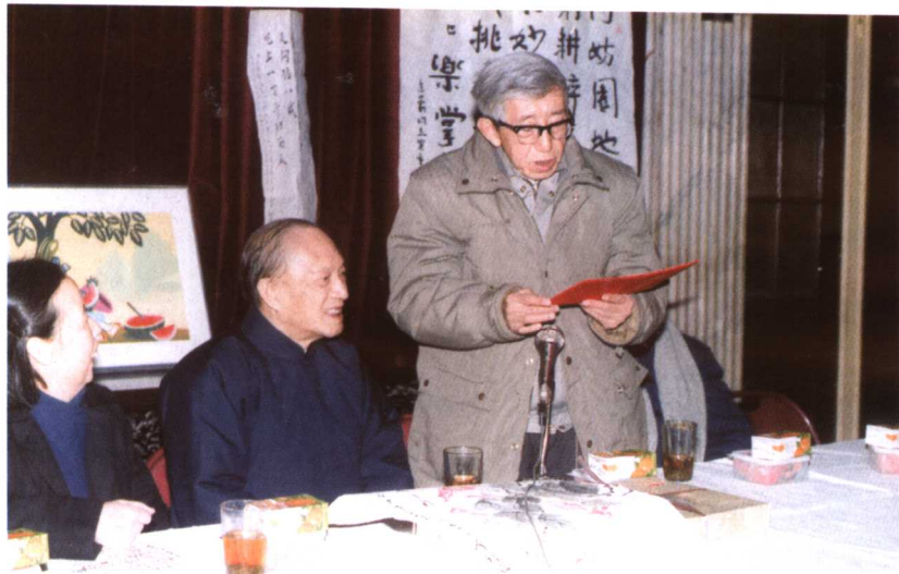
著名动画专家、原上海美术电影制片厂厂长特伟（右一）在研讨会上宣读贺词。