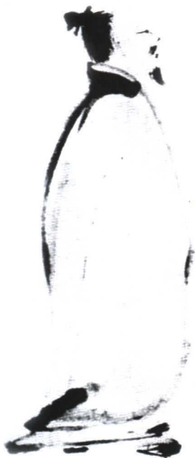
图2《李白行吟图》宋 梁楷

入化，跃然纸上。他的《泼墨仙人图》又以粗阔浓郁的水墨泼写而成，把一个开口就笑的布袋和尚的形象活现在人前，使人百看不厌。这种画风，直接影响了后世的写意人物画（图3），使其具有“拙规矩于方圆，鄙精研于彩绘，笔简神具，得之自然”的特色。这一特色为后世的写意人物画家广为借鉴，形成人们喜闻乐