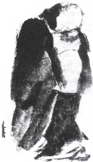
图3《泼墨仙人图》宋 梁楷

性。正如潘天寿所说：“整体形神一致之表达，是由立意、形似、骨气三者，而总归于用笔之描写，实为东方绘画之神髓。”所以写意人物画在造型上始终是突出线的优势。舍去物体的明暗因素，把体面关系转化为线，以线造型成为写意人物画的形式特点。