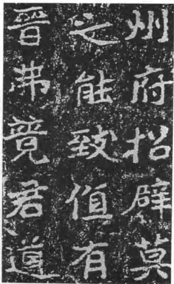
图八 北魏《郑文公碑》