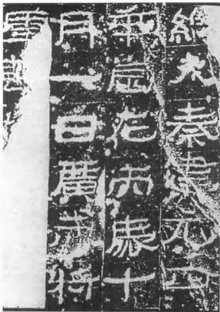
图四 前秦《广武将军碑》