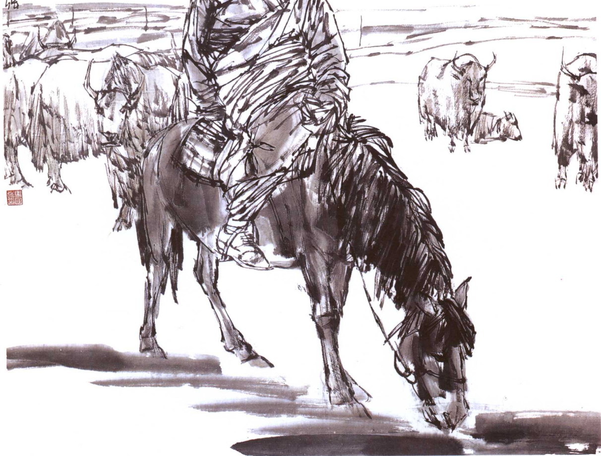
09 | 高原秋牧 68cm × 68cm · 1998