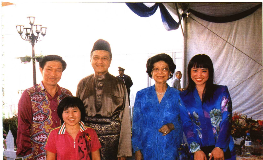
全家人和马哈蒂尔夫妇在绿野仙踪过开斋节。