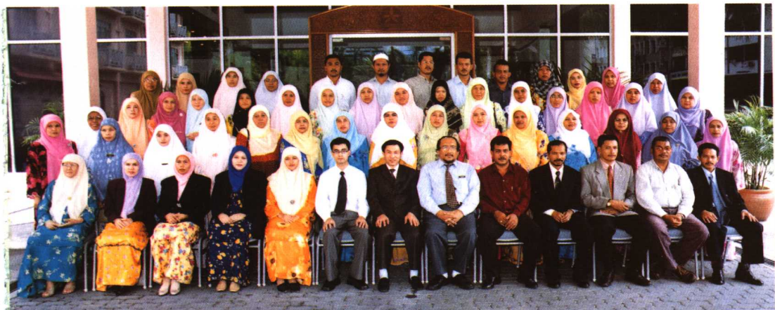
桃李争辉，珠心算老师已遍布马来西亚。