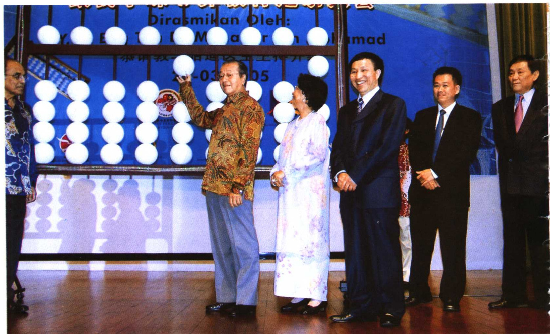
马哈蒂尔拨动算珠，号召国民学习中国珠心算。