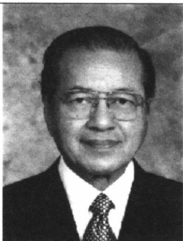
马来西亚前总理马哈蒂尔