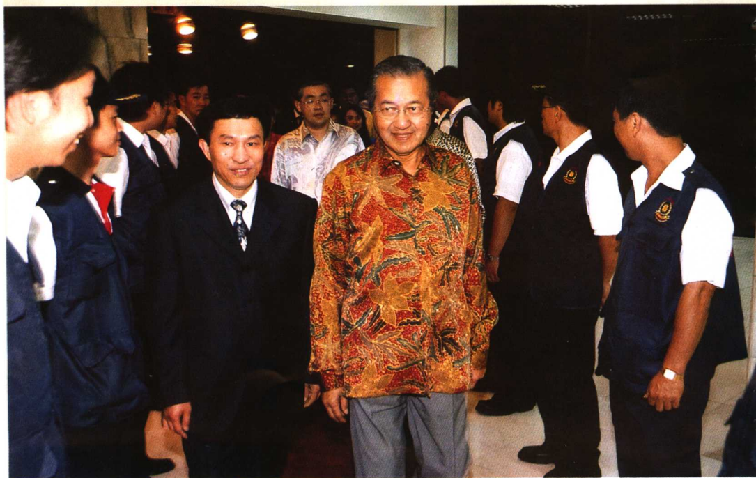
一介布衣，一国总理，并肩前行。