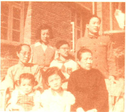
五十年代后期与家人合影