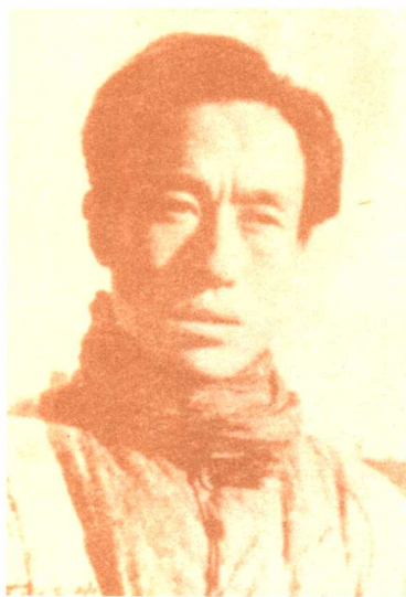
一九四一年在延安