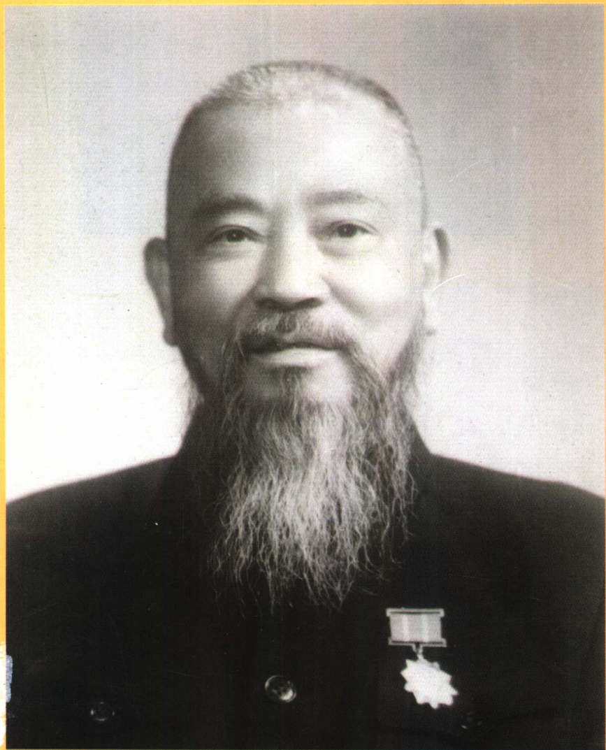
冉雪峰先生像 1959年·北京