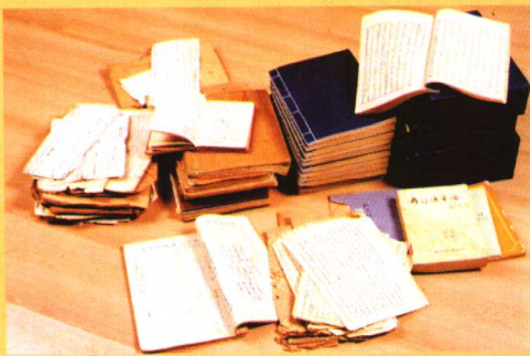
部分手稿及出版物